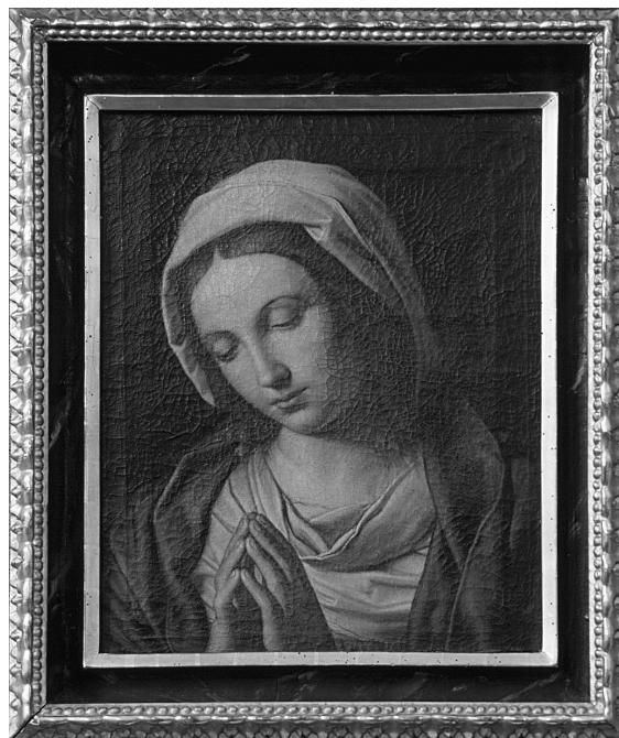
Obr. 2: Giovanni Battista Salvi, zvaný Sassoferrato (1609–1685), Madona na modlitbách – kopie, olej, plátno, Brtnice, farní kostel sv. Jakuba Většího.

lečenského života. Byl velitelem benátského Arsenalu, starostou v Bressii, státním inkvizitorem, představeným Rady desíti a generálem v Palmanově (Comandante dell'Arsenale di Venezia, Podestà di Brescia, Inquisitore di Stato, Capo del Consiglio dei X, Generale a Palma). Po vpádu Francouzů do Benátek (a po uzavření míru v Campoformiu roku 1797, který znamenal pro Benátky ztrátu samostatnosti a podle něhož kdysi slavná Serenissima připadla Rakousku) jako velitel pevnosti Palmanova vyhlásil neutralitu. Než aby se vzdal, stáhl se raději do Gorizie a odtud odešel do Vídně, kde se vyznamenal svou neústupností vůči Napoleonovi. U císařského dvora nastoupil dráhu úspěšné kariéry, jejímž vyvrcholením bylo udělení řádu Zlatého rouna a povýšení do knížecího stavu (Principe dell'Impero Austriaco) císařem Františkem I. roku 1822. Od císaře získal