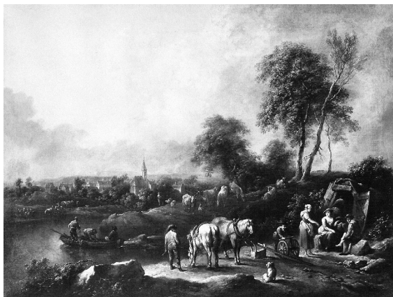
Obr. 8: Johann Christian Brand, Krajina se zvířaty I , olej, plátno, Národní galerie v Praze.