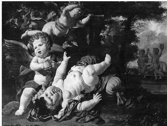
Obr. 7: Caspar Netscher nebo Gérard de Lairese – způsob (?) , Dětské bakchanále , olej, plátno, Národní galerie v Praze.