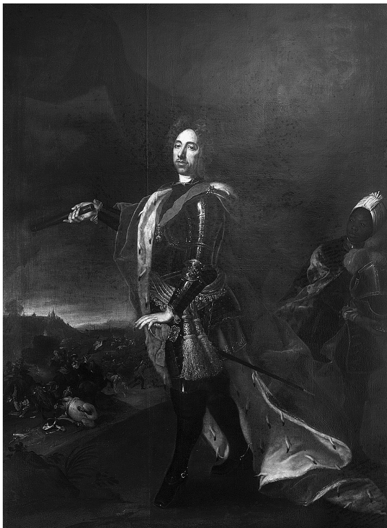
Obr. 4: Jan Kupecký, Portrét Evžena Savojského , olej, plátno, Moravská galerie v Brně.