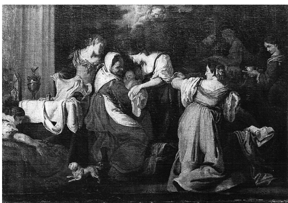
Obr. 5: Karel Škréta, Narození sv. Jana Křtitele , olej, plátno, Národní galerie v Praze.