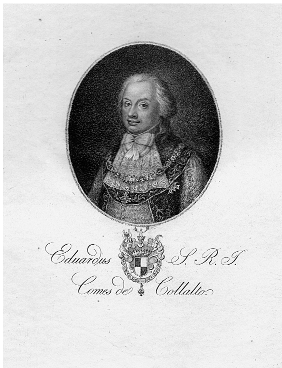
Obr. 1: Odoardo kníže Collalto e San Salvatore, lept, Moravský zemský archiv v Brně.

lečenského života. Byl velitelem benátského Arsenalu, starostou v Bressii, státním inkvizitorem, představeným Rady desíti a generálem v Palmanově (Comandante dell'Arsenale di Venezia, Podestà di Brescia, Inquisitore di Stato, Capo del Consiglio dei X, Generale a Palma). Po vpádu Francouzů do Benátek (a po uzavření míru v Campoformiu roku 1797, který znamenal pro Benátky ztrátu samostatnosti a podle něhož kdysi slavná Serenissima připadla Rakousku) jako velitel pevnosti Palmanova vyhlásil neutralitu. Než aby se vzdal, stáhl se raději do Gorizie a odtud odešel do Vídně, kde se vyznamenal svou neústupností vůči Napoleonovi. U císařského dvora nastoupil dráhu úspěšné kariéry, jejímž vyvrcholením bylo udělení řádu Zlatého rouna a povýšení do knížecího stavu (Principe dell'Impero Austriaco) císařem Františkem I. roku 1822. Od císaře získal