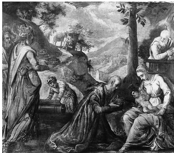
Obr. 3: Lambert Sustris (?), Klanění tří králů , olej, plátno, Národní galerie v Praze.