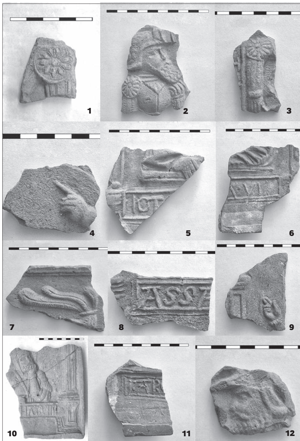
Obr. 2. Slezská Ostrava, zámek: 1 – Gedeon. Bruntál, zámek: 2–4 – Jephtha; 5 – Jonathan; 6 – David; 7 – Abia či Ezechias; 8–9 – Asa; 10 – Josaphat; 11–12 – neurčeny.