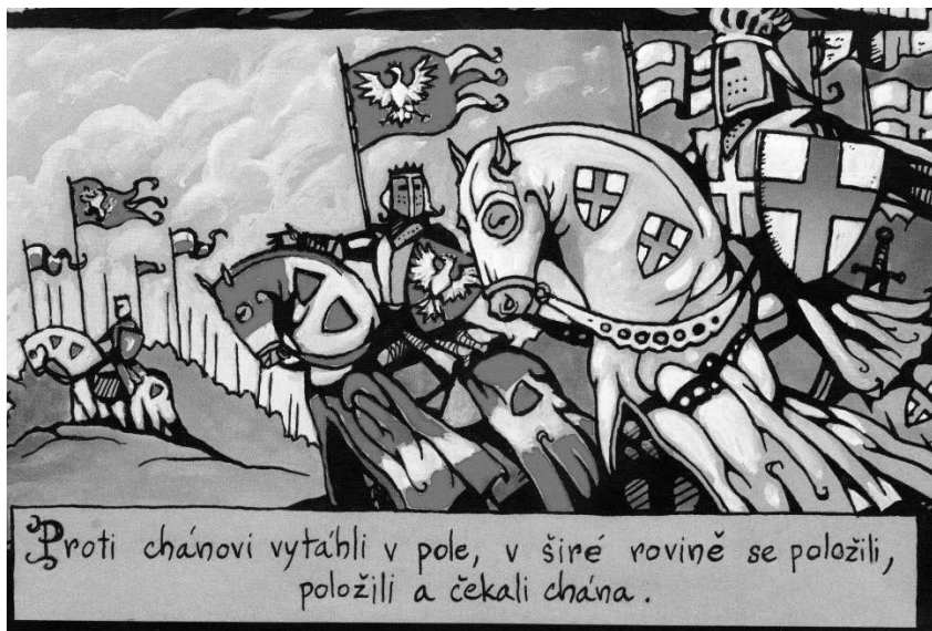
obr. 3 (cit. dílo, 2007, str. 7)

Ráz maleb dobrodružných komiksů je zachován i ve vykreslení krásné Kublajevny (v básni je líčena jako osoba, jež je „celá oblečena zlatohlavem, hrdlo, ňadra měla odhalená, perlami, kameny ověčena“ – str. 6). Věrné přenesení tohoto slovního popisu do vizuální podoby však žánr komiksu dobrodružného a historického zčásti posouvá do oblasti komiksů erotických.