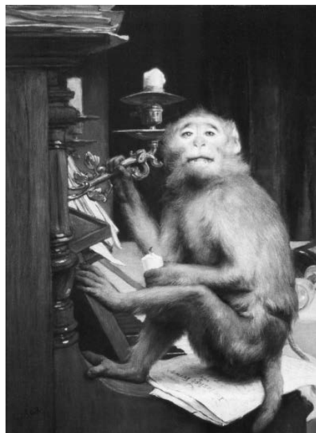
Př. 9 Gabriel von Max, Opice u klavíru, po 1905, olej na dřevě. Soukromá sbírka.

tvárnou terminologií najdeme analogii již v roce 1780, kdy je doložen pojem Tongemälde pro hudbu usilující o líčení krás přírody; toto uvažování je příznačné také pro programní hudbu Hectora Berlioze či Franze Liszta a pro teorii umění kolem roku 1900. 53 Mladý umělec tak svým cyklem hudebních fantazií rozklesne oblouk mezi romantismem a symbolismem; mohli bychom přitom uvažovat o specifické tradici „temného romantismu“, ostatně na letošní pařížské výstavě věnované tomuto fenoménu, který definoval Mario Praz, byl Max zastoupen. 54 Romantickým hrdinou umění, jehož kult kulminoval v době kolem roku 1900, byl jeho oblíbený skladatel Ludwig van Beethoven. Maxe inspirovaly také klavírní skladby Mendelssohna-Bartholdyho, Liszta, či Schumanna, ale v Beethovenových sonátách našel nejurčitější vyjádření specifických emocí a duševních stavů. Jejich subjektivně motivovaná výtvarná znázornění nabídl překvapenému uměleckému publiku.