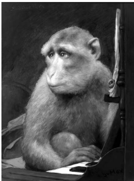
Př. 8 Gabriel von Max, Písně beze slov , po 1900, olej na dřevě. Sběrka Jacka Daultona, Los Altos Hills, Kalifornie, USA.