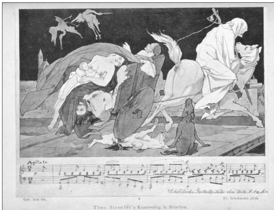
Př. 5 Gabriel von Max, Obrazové fantazie k hudebním skladbám, 8. list cyklu k Mendelssohnovu agitatu a moll z cyklu Lieder ohne Worte , 1862. Repro dle 3. vydání, 1885.