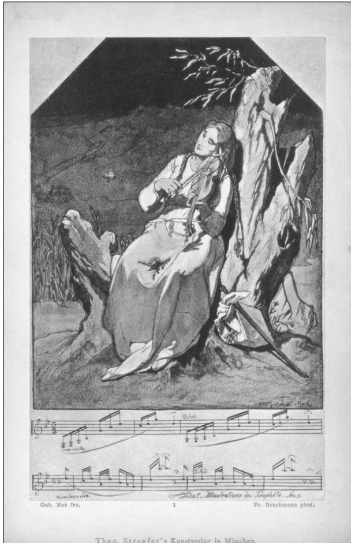
Př. 3 Gabriel von Max, Obrazové fantazie k hudebním skladbám, titulní list cyklu ke klavírní skladbě Illustrations du Prophète , Nr. 3 Franze Liszta, 1861. Repro dle 3. vydání, 1885.

v Praze v době jeho mládí takovýto soubor vystupoval a existoval ještě v době vydání Lehmannovy monografie. 29 Také jeho učitel hudby Josef Prosch byl slepý. O tomto motivu lze uvažovat ještě jinak: niterné prožívání hudby odkazuje na jedno z pozdějších symbolistických topoi zavřených očí. 30 Maxovo zařazení