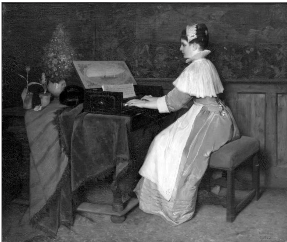
Př. 7 Gabriel von Max, Zátiší (Dívka u spinetu) , 1871, olej na plátně. Oblastní galerie, Liberec.

než syžetových cenil formálních analogií mezi hudbou a kresbou; při spojení obou hledisek můžeme jeho kompozice rozdělit na dramatické a lyricko-meditativní. Ty druhé, do nichž spadají mimo jiné všechny vizualizace hudebních produkcí, jasně převažují, zatímco výrazně dramatické, v patetickém duchu Kaulbachova umění, jsou jen dva listy s eschatologickými náměty. Dva pašijové náměty odpovídající VIII. a XII. zastavení Křížové cesty stojí na pomezí mezi těmito dvěma přístupy. Dramatické scény jsou vystavěny na kompozičních diagonálách, ostrých úhlech a patetických gestech figur, zatímco lyricko-meditativní scény mají buď ortogonální kompozici, někdy i symetrickou, nebo jsou založeny na nehluboké prostorové diagonále, a také na měkce splývavých liniích.