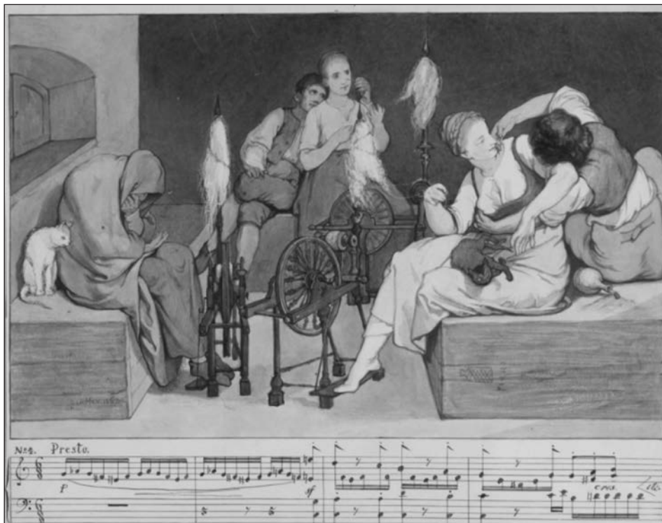
Př. 2 Gabriel von Max, Obrazové fantazie k hudebním skladbám, 5. list cyklu k Písním beze slov Felixe Mendelssohna-Bartholdyho k Písni tkalců (op. 67, č. 4), kresba tuší, kolorovaná akvareem. Shepherd Gallery, New York.

středky bezprostředně nálady, kterou líčí, přičemž u ní nehrozí, v tak velké míře jako u výtvarného umění, „zkrácení estetického požitku nepovolnou myšlenkou či estetickým předsudkem“. Max vysvětluje, že ve svých kreslířských kompozicích přistoupil k hudbě dvojím způsobem: 1) Skrze čistě subjektivní spojení hudebního a imaginativního vjemu, jež je založeno na jeho zkušenosti: „die Erfahrung, dass ein vor Jahren gehörtes und lieb gewonnenes Tonstück, in späteren Jahren wiedergehört, die ganze Stimmung und Situation, unter der man dasselbe zuerst liebgewonnen, auf merkwürdig lebhaft Weise illustriert reproducirt.“ 14 2) Objektivnějším a všeobecnějším vyjádřením života mysli ( Gemüthsleben ) skrze hudbu, když výtvarná práce má vzbudit podobnou náladu jako hudební dílo, ovšem opět bez konkrétních obsahových odkazů, se snahou o propojení s jeho všeobecným charakterem.