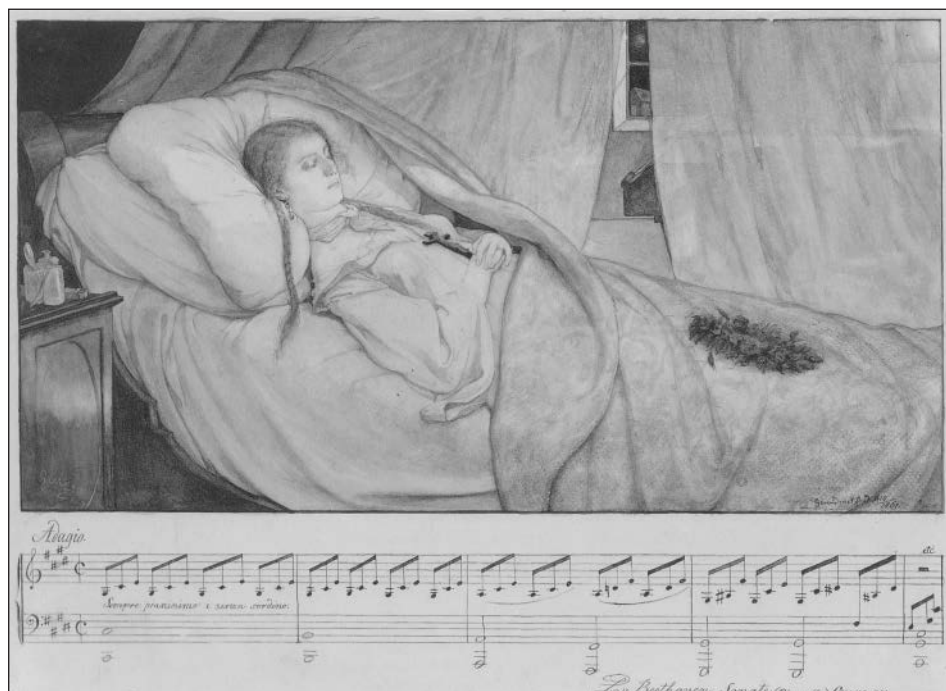
Př. 1 Gabriel von Max, Obrazové fantazie k hudebním skladbám, 3. list cyklu k Beethovenově klavírní Sonátě měsíčního světla (opus 27), 1861, kresba tužkou a štětcem. Kunstforum, Ostdeutsche Galerie, Regensburg.

Svébytnou součástí díla je osmistránkový autorský výklad datovaný v Praze v červnu 1862. V úvodu Max objasnil svůj tvůrčí přístup k hudební tematice. Vymezil se vůči obvyklým vizualizacím, kdy se jedná o pouhé zobrazení námětu (např. textu písně). Zdůraznil schopnost hudby dosáhnout svými vlastními pro-