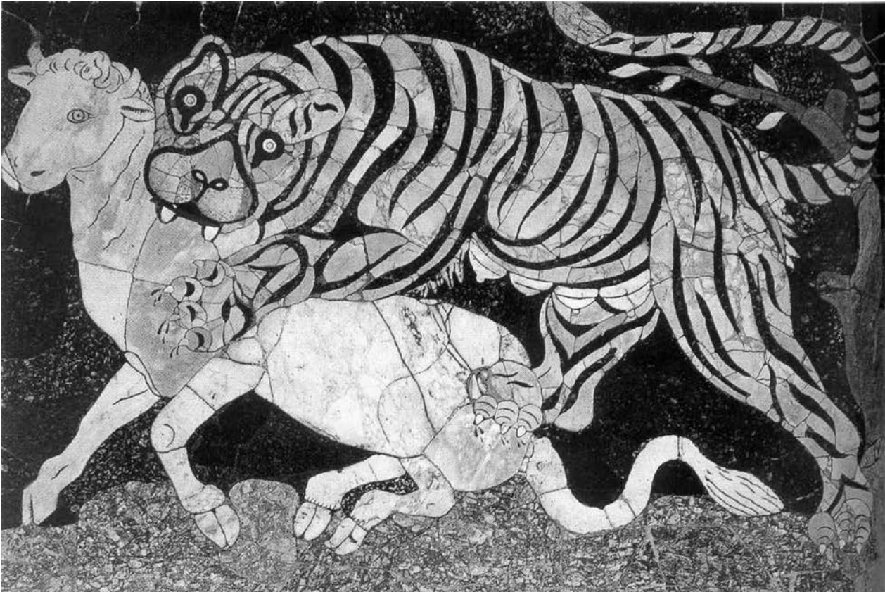
1 – Panneau en opus sectile de la maison de Junius Bassus, IV siècle. Rome

parfois rangés avec les ouvrages sur l'Antiquité, parfois avec le Moyen Âge, éventuellement avec l'Islam ou dans un « divers » qui peut aussi bien les rapprocher de l'art des Inuit que de celui des Aborigènes. C'est encore cette ambiguïté qui fait que, dans une collection bien connue, un volume intitulé « Le Monde byzantin I » ne peut traiter que des provinces orientales, avec quelques incursions inévitables en Occident, malgré l'unité de l'empire romain au IV e siècle, encore revendiquée et effective à de nombreux points de vue, un volume différent étant prévu pour la partie occidentale de l'empire. 3 Cette situation paradoxale reflète, d'une certaine façon, le paradoxe des origines de cet empire, qui, chronologiquement, 4 ne se laissent pas fixer aisément et qui le voient, en quelque sorte, migrer de ses terres d'origine vers un monde dont les traditions sont différentes et dont la langue n'était pas celle du pouvoir, de l'administration et de la législation. 5 Ce sont quelques aspects de cette situation ambiguë, de ces paradoxes et de leurs conséquences qui sont la matière de cet article.