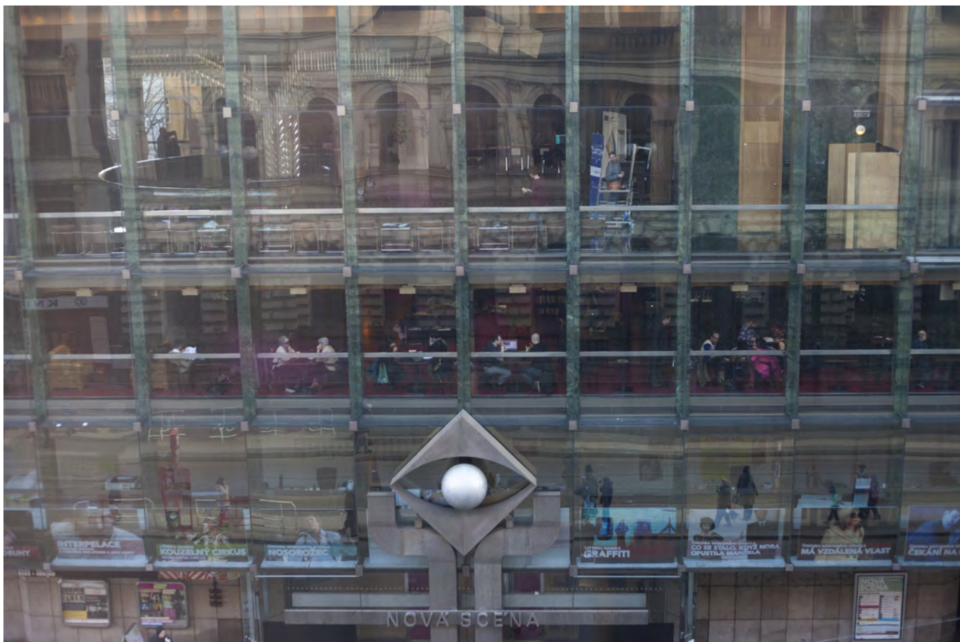
Obr. 13. Priestor k interakcii divákov a aktérov medzinárodnej konferencie: kaviareň Novej scény Národného divadla.

s porozumením niektorých výkladov a textov, a to hlavne z dôvodu náročnosti jej akademického kontextu. Na druhej strane bola práve už zmienená multikulturalita jedným z dôvodov veľmi uvoľnenej a priateľskej atmosféry konferencie, ktorá poskytovala mnoho príležitostí ku komunikácii a interakcii medzi akademikmi, umelcami a publikom.