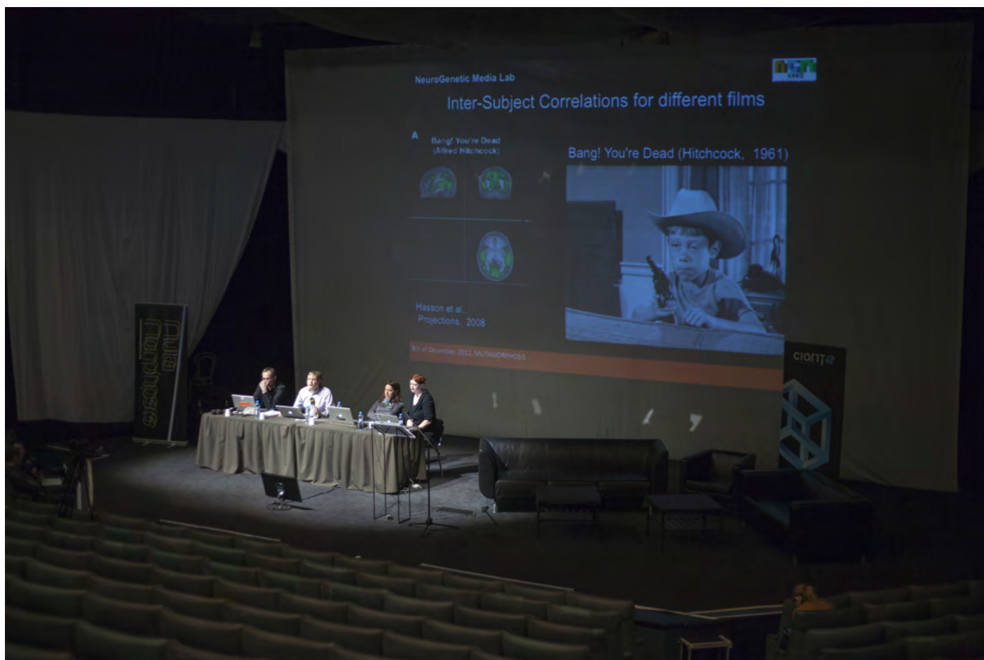
Obr. 8. Prednáška Neurogenetic Media: From Research Tool to New Art Applications na Novej scene.