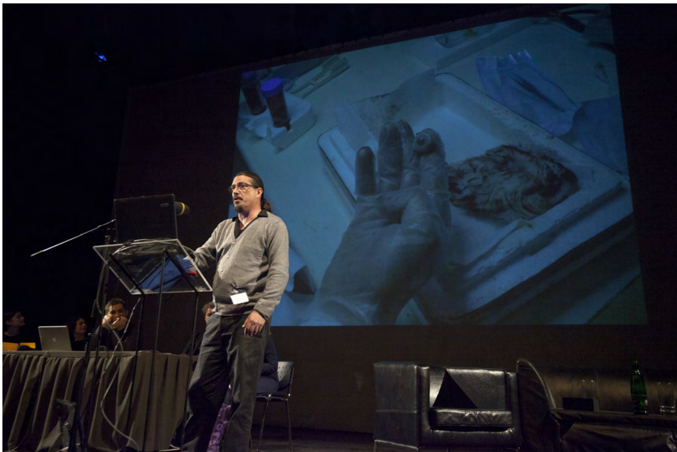
Obr. 2. Oron Catts prezentuje vrámci příspěvku Crude matter: the milieu as life enabling .

V prvním příspěvku Crude matter: the milieu as life enabling Oron Catts a Ionat Zurr navázali na příběh pražského Golema (v překladu znamená „hrubý“, „neopracovaný“), na kterém ilustrovali myšlenku existence života v neživé hmotě a představili svůj projekt, v němž se pokoušejí vytvořit v laboratorních podmínkách život - kožní tkáň - z neživých zvířat, což se jim i daří. Tuto přednášku, která jde opravdu „na dřeň života“ můžete vidět zde http://vimeo.com/56462011 .