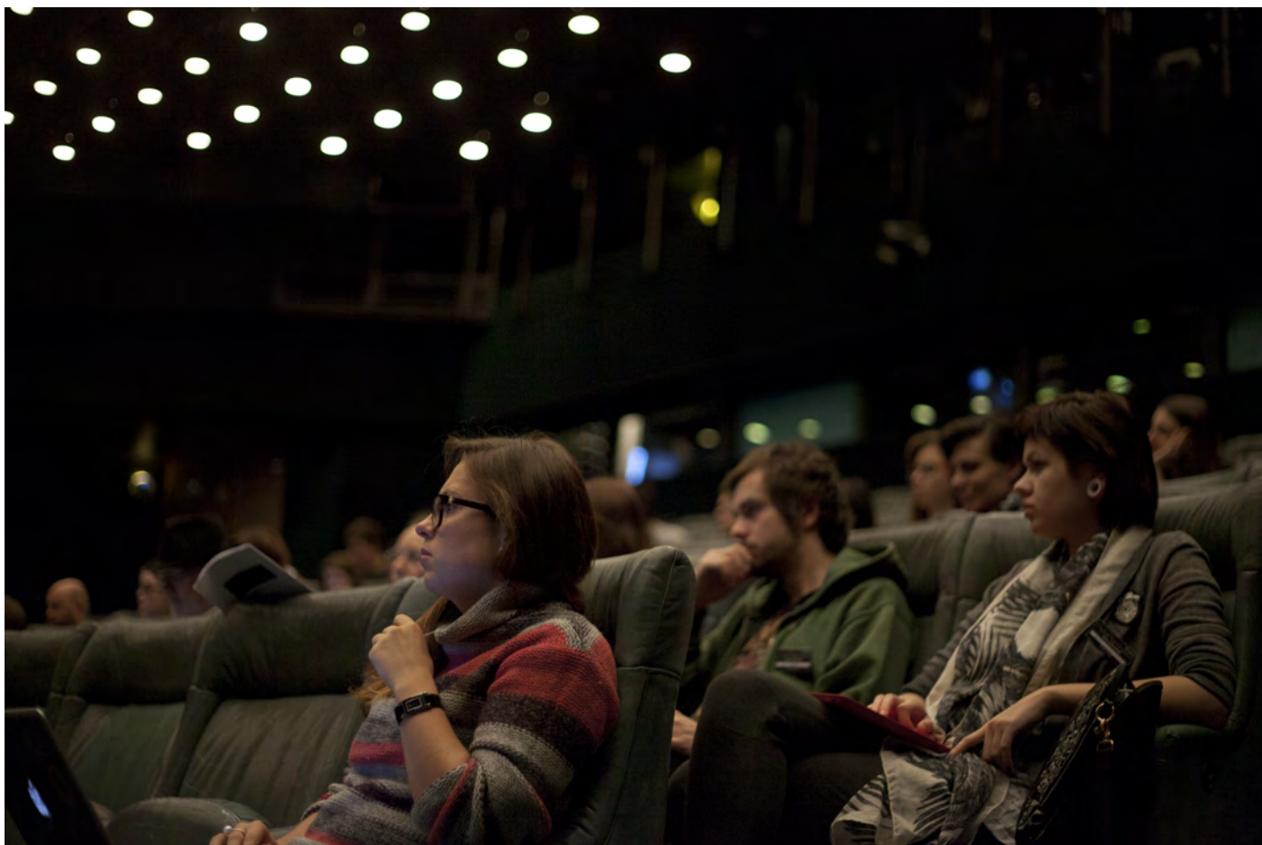
Obr. 14. Priestory Novej scény Národného divadla dodávali konferencii veľmi príjemnú atmosféru.