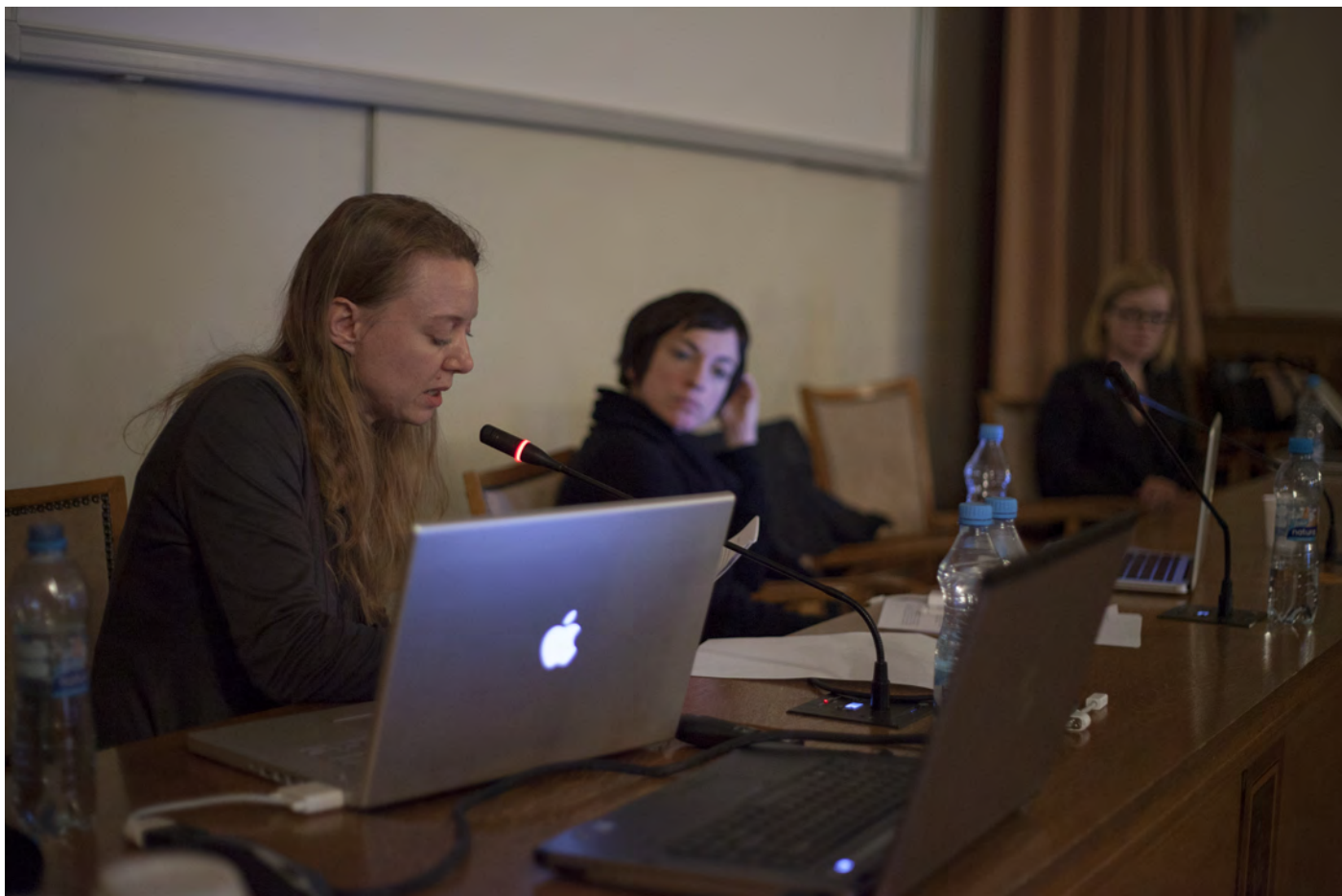
Obr. 9. Jedna z posledných prednášok konferencie MutaMorphosis v priestoroch Akadémie vied ČR Addressing the Future: The Tactics of Uncertainty.

Záverečná prednáška konferencie s názvom Nomadic Science BioHackLab a Extreme Metabolic Interactions: Cooking for Apocalypse predstavila spoločne DIY (do it yourself = urob si sám) biológov a bio-hackerov. Najväčší divácky záujem snád' vzbudil projekt Hot Karot pražských študentiek nových médií ( http://www.vyvarovna.com/2011/12/hot-karot-mrkev-v-rohliku.html ). Myšlienkou bolo hackovanie tradičného hot dogu, ktorý síce nie je zdravý, ale je lacný, tým, že ho autorky zamenili za mrkvu v celozrnnom rohlíku.