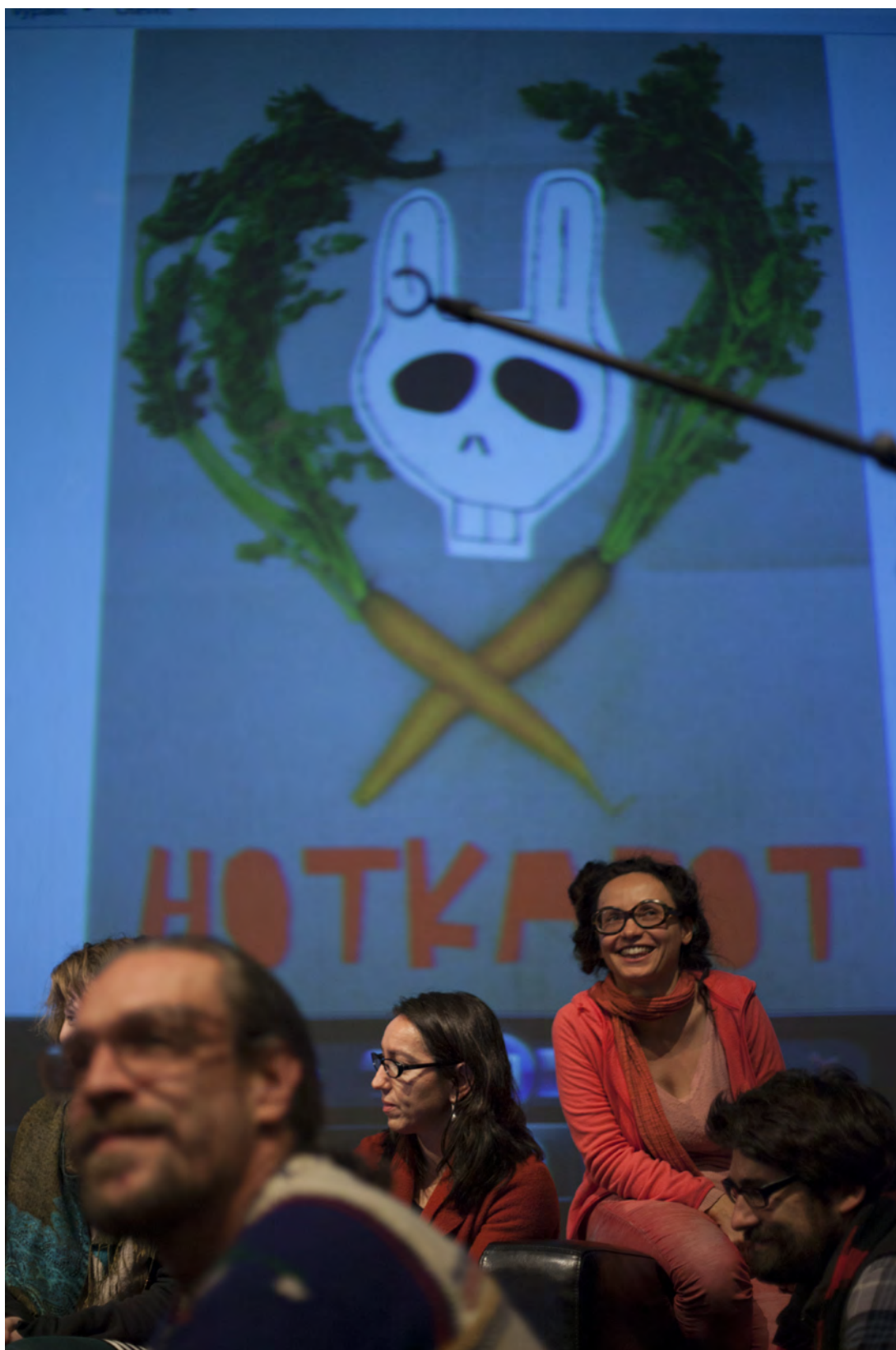
Obr. 10. Závěrečná přednáška konference Nomadic Science BioHackLab a Extreme Metabolic Interactions: Cooking for Apocalypse .