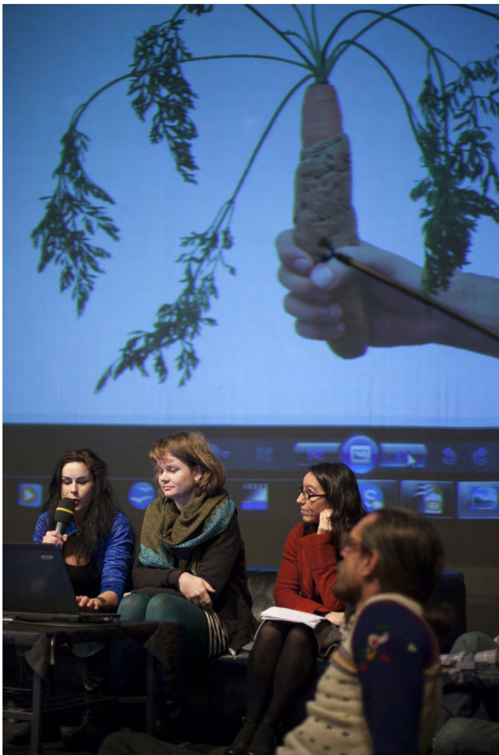
Obr. 11. Projekt Hot Karot pražských študentiek nových médií.

Mrkva ako náhrada hot dogu putovala najprv medzi ľuďmi na ulice, neskôr do kyberpriestoru. Mala podnieť zmenu myslenia o jedle a vizualizácii jedla. Išlo predovšetkým o hackovanie kuchárskych praktík, o rezistenciu mrkvy, kým na nej skúšali rôzne experimenty, vypestovanie nového tvaru a druhu mrkvy.