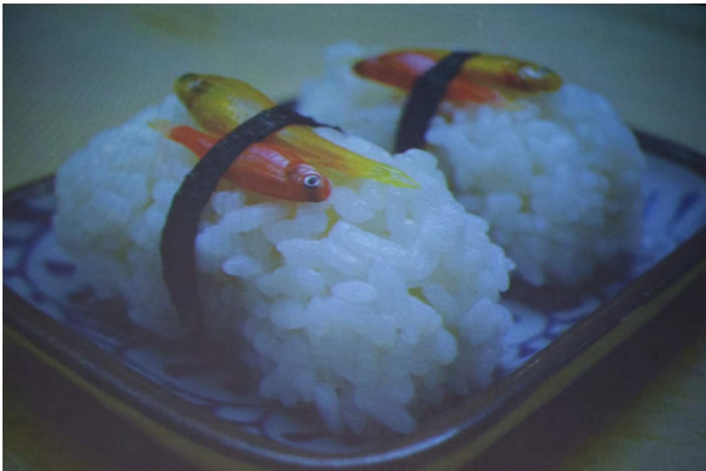
Obr. 17. Ukázky DIY biológov bio-hackerov na téma gastronómie vrámci záverečnej prednášky konferencie.