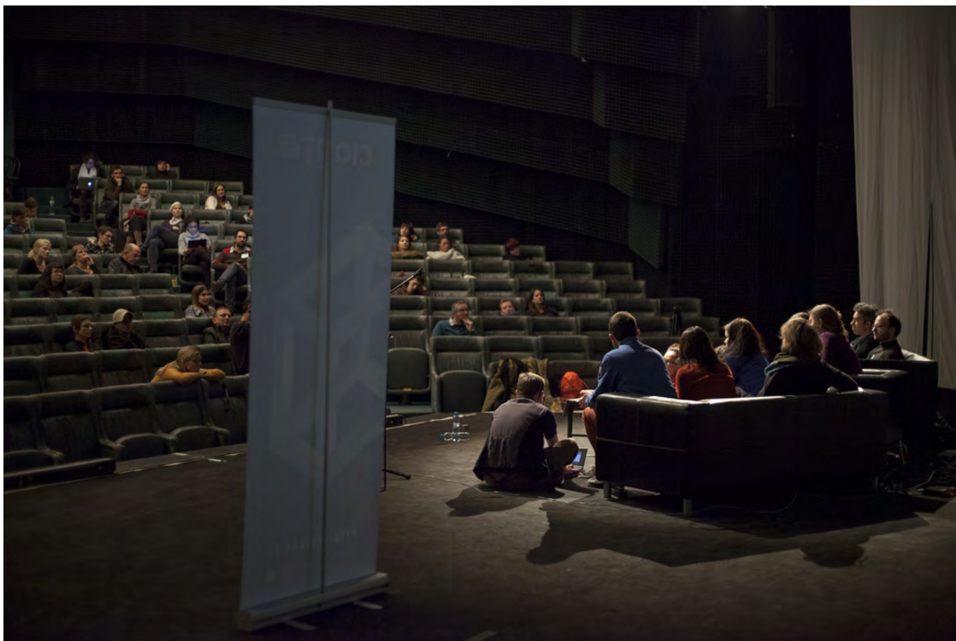
Obr. 12. Publikum Novej scény ND počas posledného vstupu konferencie.

V mnohých ohľadoch bola táto diskusia zhrnutím toho, čo sa doposiaľ deje v hackerskom priestore a oslavou DIY biológie.