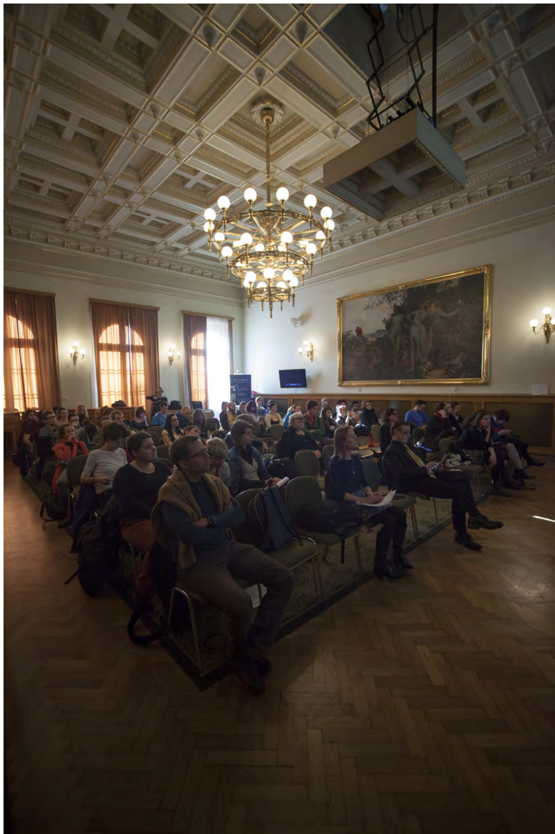
Obr. 15. Prednášková miestnosť na Akadémii vied ČR vrátane pedagógov a študentov TIMu.