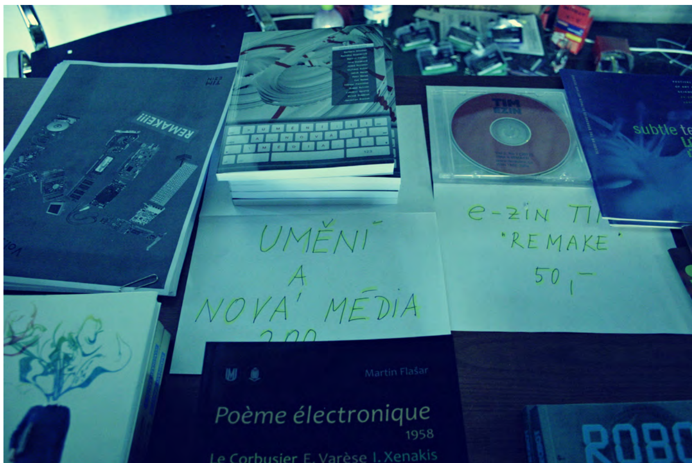
Obr. 20. Publikácie TIMu boli k dispozícii pre návštevníkov konferencie na Novej scéne ND.