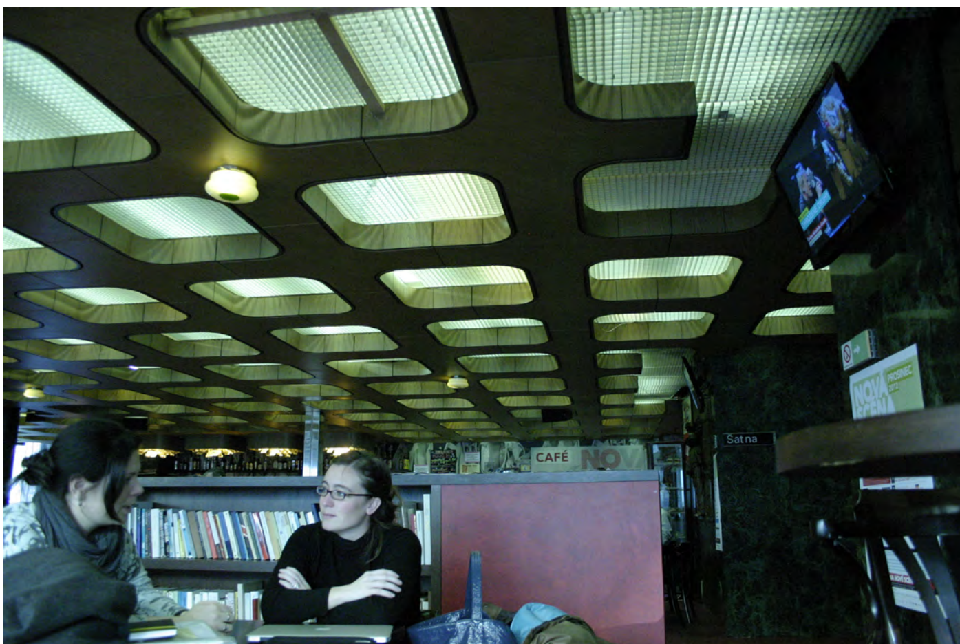
Obr. 19. Kaviareň na Novej scéne Národného divadla ako miesto stretávania účastníkov konferencie.