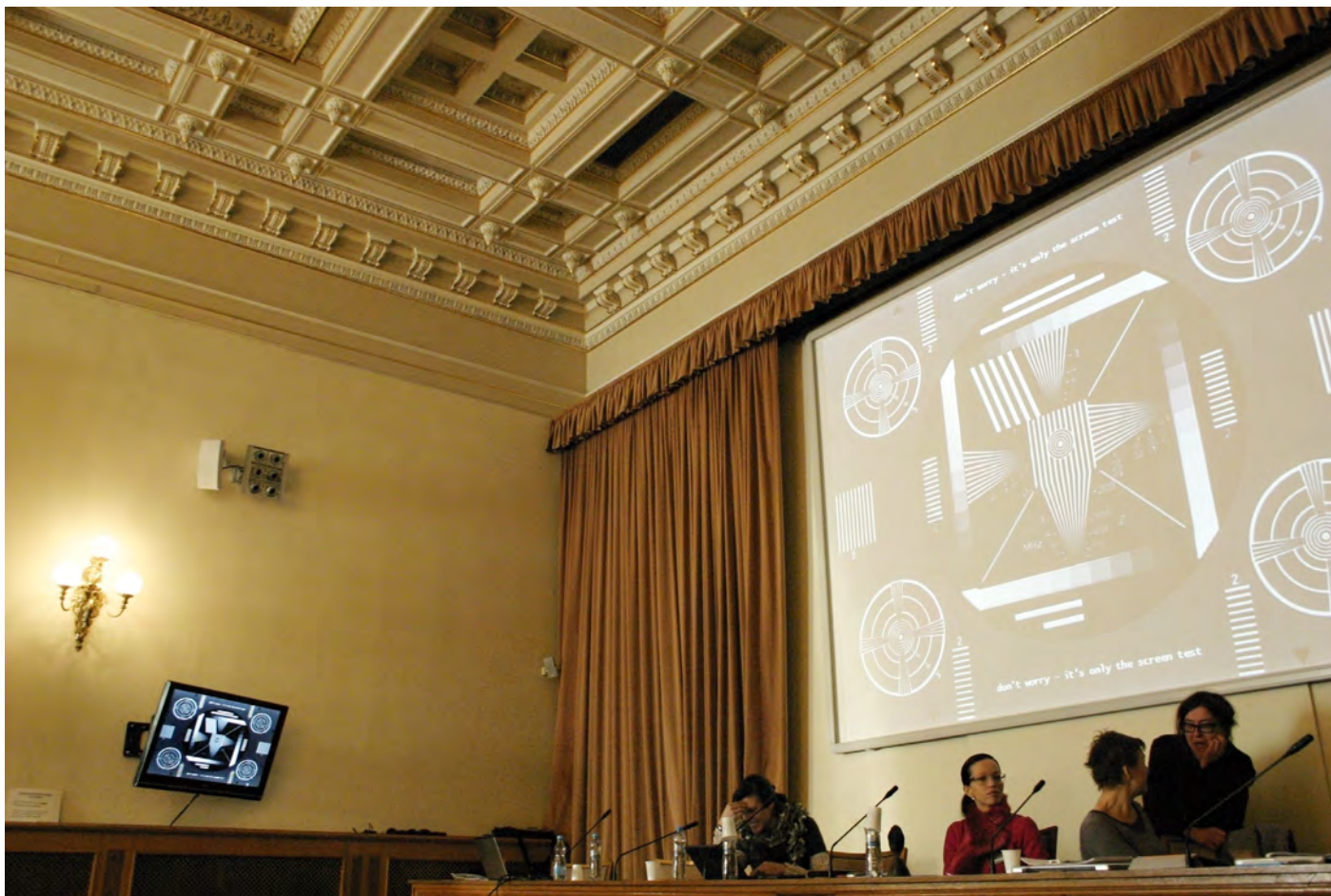
Obr. 21. Přípravy k bloku přednášek Philosophical Toys Today atraktora Tomáše Dvořáka.