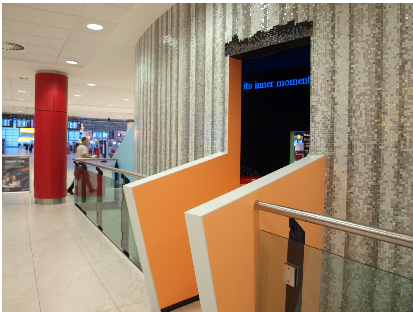
Obr. 1. Forum Havlum v přízemí přístávací schengenské haly pro země Evropské unie.

Bořek Šípek (1949), autor instalace, pojal toto umělecké dílo jako vyjádření pocty svému zesnulému příteli Václavu Havlovi (1936–2011) a jako připomenutí jeho celoživotního díla dramatického, spisovateckého i politického. Šípek vytvořil dílo připomínající malou divadelní scénu, kde jako hlavní aktéři vystupují Havlovy texty, které zdánlivě probíhají éterem coby myšlenky, jež po sobě Havel zanechal (Šípek, 2012). Forum Havlum tak dává možnost všem kolemjdoucím, náhodným či cíleným, vzpomenout si na tuto významnou osobnost.