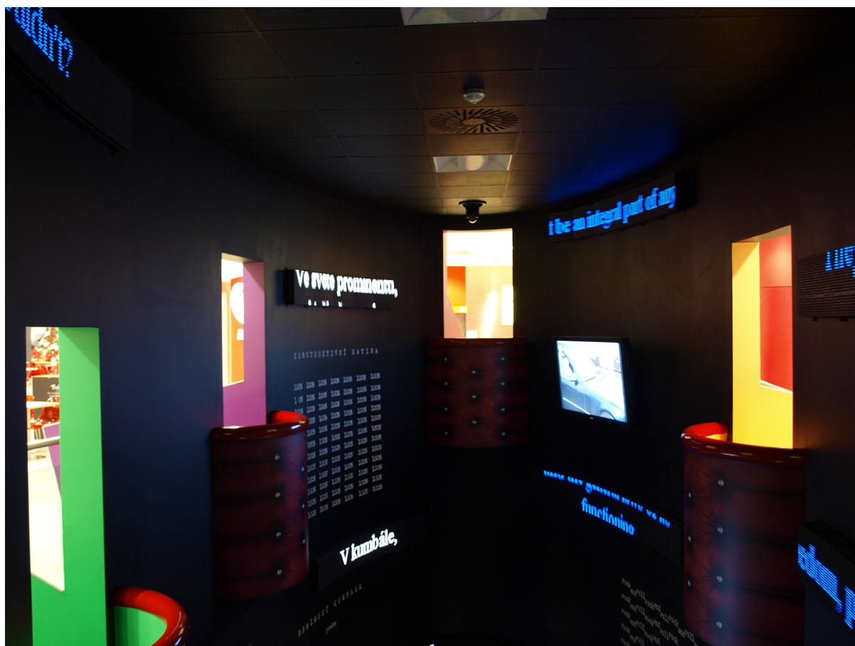
Obr. 4. Pohled do vnitřního prostoru instalace Forum Havlum, „divadla paměti“.

(1480–1544). Divák/herc vstupující do divadla je rázem obklopen citáty a výroky Václava Havla, jež jsou promítány v češtině i angličtině na speciálních LED obrazovkách. Vzhledem k mezinárodnímu charakteru prostoru byla záměrně zvolena dvojjazyčná forma vybraných citátů a výroků. Výběr konkrétních textů měla na starost Knihovna Václava Havla, která se snažila vystihnout Havla nejen jako dramatika, ale také jako prezidenta, filozofa a občana. (Umělecké dílo, 2012)