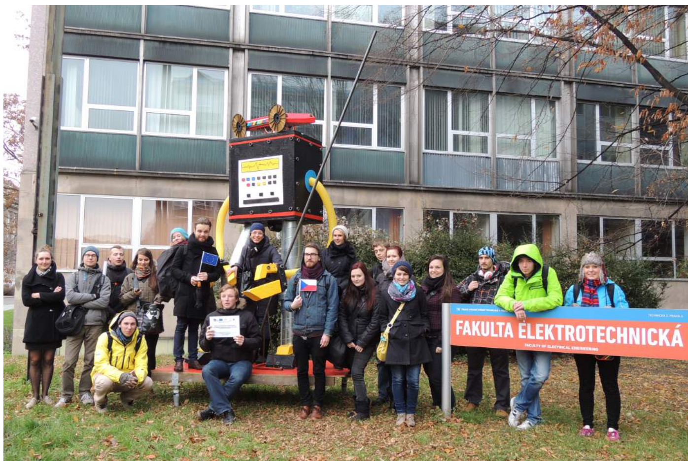
Obr. 10. Pamáтеční foto exkurze TIMu ze setkání s robotem z FELu (Fakulta elektronická na ČVUT)

Festival probíhá v rámci projektu č. CZ.1.07/2.2.00/28.0044 Inovace uměnovědných studijních oborů na Filozofické fakultě MU, který je spolufinancován Evropským sociálním fondem a státním rozpočtem České republiky. Viz www.phil.muni.cz/music/opvk .