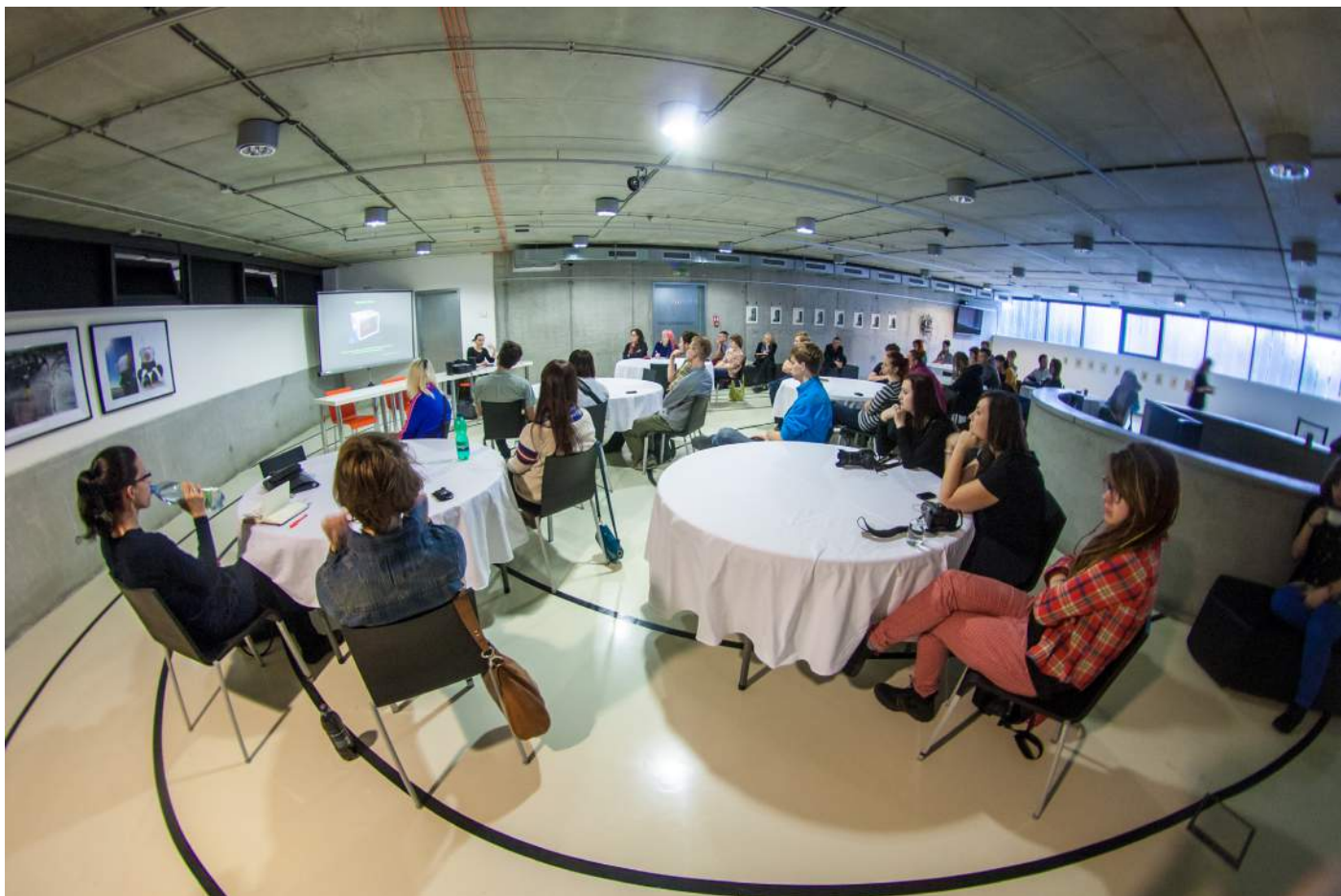
Obr. 2. První patro Galerie NTK, kde výstava pokračovala, bylo vyhrazené především pro přednášky a prezentace.