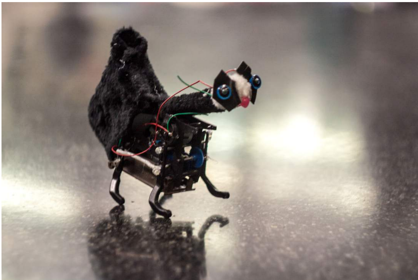
Obr. 7. Po dobře odvedené práci si každý mohl donést domů svého vlastního robůtka.