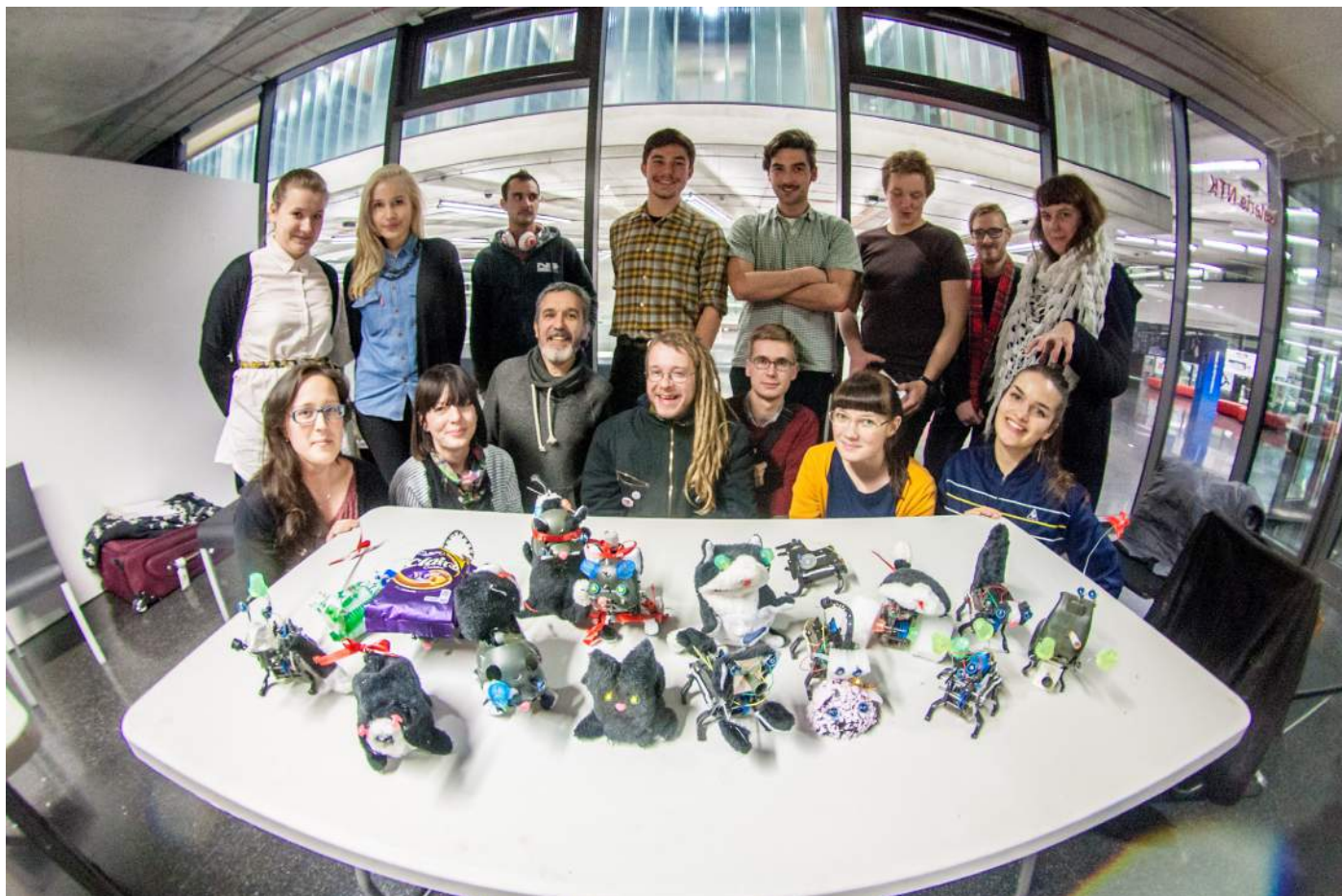
Obr. 8. Hrdí účastníci jednoho z workshopů se svými výtvy.