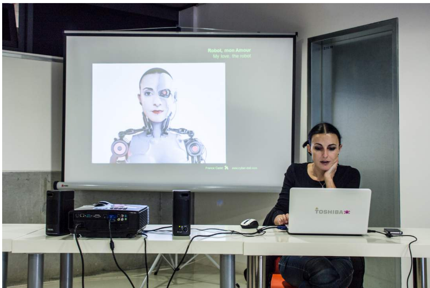
Obr. 3. Francouzská umělkyně France Cadet přednášela o kyborzích a umělé inteligenci.