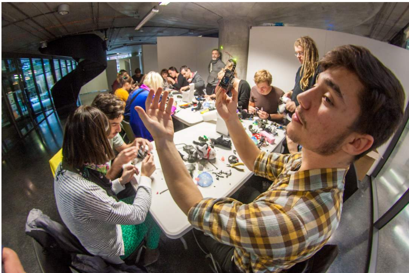
Obr. 6. Electronic Puppet Workshop se Zavenem Paré probudil v každém kreativního ducha.