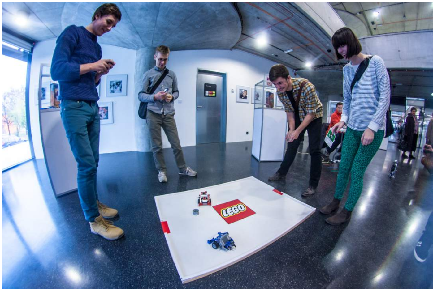
Obr. 5. I o LEGO MINDSTORM robotickou hru byl velký zájem.