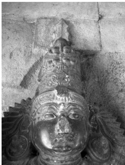
Fig. 3. Divinité gardienne, portant une « śakti » au sommet de la tête, à gauche de l'entrée de temple de Murukaṅ-Skanda dans l'enceinte du Bṛhadīśvara de Tanjore (XVII e s.).

śakti . Dans ce cas, la représentation élaborée dans la tradition sculptée propre au pays tamoul s'est imposée dans les textes jusqu'à modifier le sens d'origine d'un terme sanskrit. Nous examinons tout d'abord cette néosémie impliquant des va-et-vient entre tradition sculptée et textes, poèmes en tamoul et documents rédigés en sanskrit.