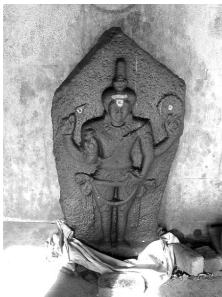
Fig. 9. Le Murukaṅ-Skanda d'Elavanacūr-kottai, VIII e -IX e s..