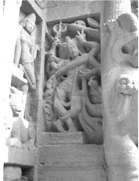
Fig. 11. Déesse dansante (Kālī?); le trident flotte à l'arrière-plan; Kailāsanātha de Kāñcīpuram, début VIII e s.

teurs ne se sont pas attaqués dans le cadre des fondations Pallava. Au moment où l'on invente dans le pays tamoul l'iconographie d'un Murukaṅ-Skanda, alors même qu'on crée de nombreuses figures de Śiva et que l'on compose un corpus littéraire précisant les formes et la mythologie de ce dieu, Murukaṅ-Skanda et Śiva doivent être clairement distingués. Il s'agissait de trouver en tamoul un terme dont la résonance symbolique pouvait répondre à celle du trident de Śiva, l'un des emblèmes du dieu le plus important de tous pour le Tēvāram . Le vēl du guerrier, de l'amant, du roi et du dieu dans la tradition littéraire tamoule du Caṅkam permettait de faire résonner l'attribut de Śiva dans le corpus bhaktique. Cette transposition n'est pas une traduction littérale. Elle donne à l'attribut de Śiva une profondeur littéraire et symbolique qu'un calque du sanskrit tel que tiricūlam ou cūlam ne possédait pas. Mais la représentation sculptée qui s'affirme alors joue un rôle important dans l'établissement de la bhakti shivaïte. Dans un tel cadre, pourvoir les figures sculptées de Murukaṅ-Skanda d'une lance et utiliser le terme vēl pour désigner le trident de Śiva dans un corpus comme celui du Tēvāram n'étaient pas compatibles.