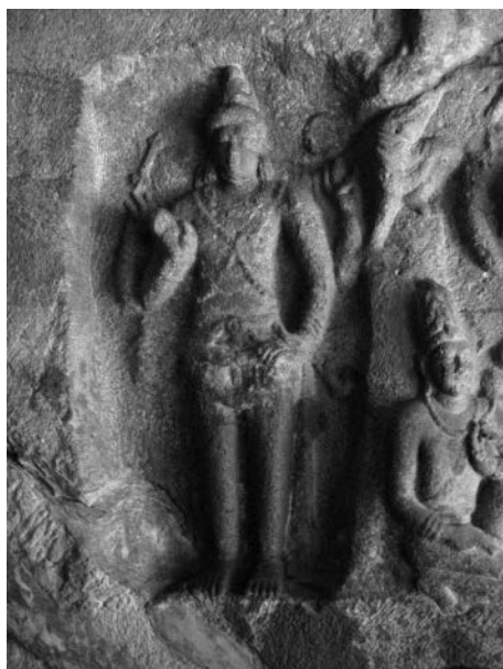
Fig. 8. Le Murukaṅ-Skanda de Malaiyati-paṭṭi, VIII e -IX e s.

VIII e s. et début du IX e s.). Le site comporte deux sanctuaires excavés, l'un organisé autour d'un Viṣṇu couché sur le serpent, l'autre d'un liṅga face auquel on a sculpté une déesse guerrière, un Hari-Hara, forme synthétique représentant à la fois Viṣṇu et Śiva (celle sur laquelle le Tamil Lexicon appuie sa définition du vēl comme trident), et un Murukaṅ-Skanda (fig. 8). Comme les deux autres figures, ce dernier dieu est debout et comme le Hari-Hara, il est pourvu de quatre bras, sa main gauche propre posée sur le haut de la cuisse, la droite élevée paume ouverte dans le geste dit d'absence de crainte. Les bras supplémentaires élèvent, de chaque côté de la tête, un foudre dans la main droite propre, et un cercle (sans doute un rosaire), dans la main gauche propre 17 . Une iconographie similaire apparaît sur nombre d'autres pièces, comme sur une stèle retrouvée bien plus au nord du pays tamoul, à Elavanacūr-kottai (fig.