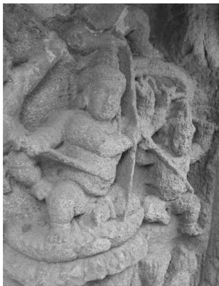
Fig. 7. Skanda opposant son arc à Indra, Kailāsanātha de Kāñcīpuram, début VIII e s.