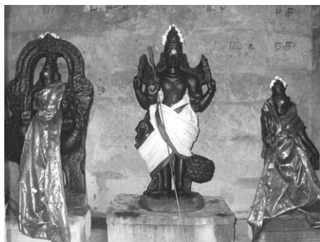
Fig. 2. Murukaṅ-Skanda à Tirumaṅkalam, XV e -XVII e s. ; éléments mobiles XX e s.