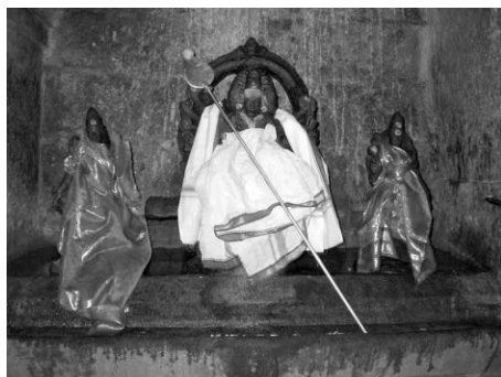
Fig. 1. Murukaṅ-Skanda à Tiruvērupūr, XV e -XVII e s. ; éléments mobiles XX e s.

Les représentations contemporaines du vēl de Murukaṅ vont dans le même sens. La très grande majorité d'entre elles sont des lances comportant un long manche s'achevant sur une pointe affectant la forme d'une large feuille à fine pointe. L'inspiration est nettement végétale. La «pointe» est parfois très semblable à une feuille de bambou, mais ressemble plus souvent à une feuille de l'arbre à bétel, l'un des sens de ilai . La lance mobile, en métal, placée devant les statues du dieu Muruku (fig. 1 et 2) ou plantée dans la terre pour signaler que tel lieu est consacré à cette divinité, semble ainsi illustrer les métaphores des textes anciens. D'autres vēl , de plus petite taille, sont utilisés dans le cadre de rituels impliquant scarification, percement du corps et diverses formes de body art auxquelles la forme stylisée de l'objet confère une grande force esthétique 3 . Ces rituels sont associés au dieu Murukaṅ.