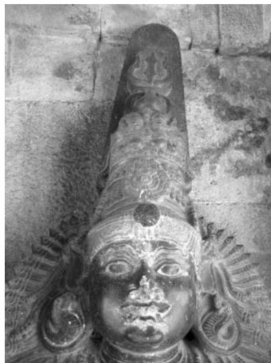
Fig. 4. Divinité gardienne, portant un foudre à base de cloche (?) ou la pointe d'un trident au sommet de la tête, à droite de l'entrée du temple de Murukaṅ-Skanda dans l'enceinte du Bṛhadīśvara de Tanjore (XVII e s.).