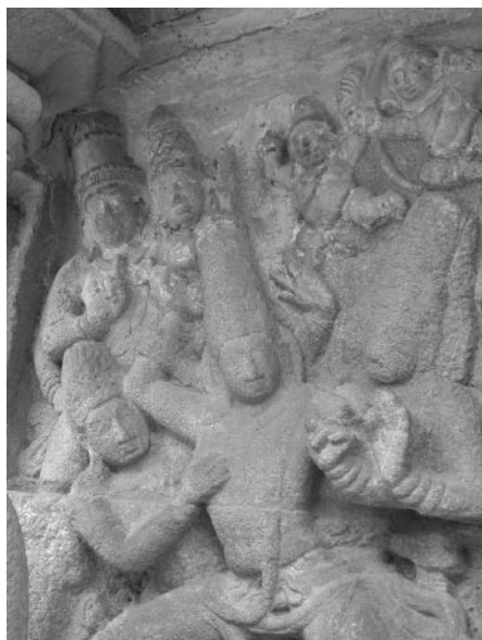
Fig. 6. Indra levant son foudre sur Skanda, Kailāsanātha de Kāñcīpuram, début VIII e s.

Les premières figures connues de Skanda-Muruku en pays tamoul prennent place dans des fondations royales. Le dieu y est pourvu d'une arme unique fois, dans une scène également unique, représentant sa naissance au Kailāsanātha de Kāñcīpuram, qui fut dédié à Śiva au début du VIII e s. par un roi Pallava (fig. 6 et 7). Skanda-Muruku est ici une figure royale, opposant un arc bien shivaïte à Indra « le Roi » qui lève son foudre contre lui, comme il le fait tant dans le MBh sanskrit : « Alors, abandonné par les dieux, Śakra (Indra) lança son foudre sur Skanda ; ainsi lancée [l'arme] frappa promptement le flanc droit de Skanda » ( Mbh 3.216.12) 11 , que dans le Paripāṭal tamoul :