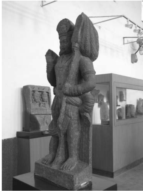
Fig. 5. Skanda portant une lance, Mathurā, II e -III e s., musée de Mathurā.

des prescriptions iconographiques (cf. Viṣṇudharmottarapurāṇa 71.5). Dans le corpus sculpté, Skanda est pourvu d'une lance dès les premières représentations connues produites en Inde septentrionale, dont certaines sont datées du I er s. de l'ère chrétienne (fig. 5). En Inde septentrionale et centrale, la lance demeure l'attribut des Skanda figurés durant les périodes kouchane et gupta (I er -VI e s.), à deux ou quatre bras, debout, assis, nourrissant un paon, ou ondoyés par Brahmā et Śiva. En Inde méridionale, dans l'art des temples creusés ou bâtis en territoire cālukya à partir du VI e s. (Karnataka et Andhra Pradesh), Skanda porte également une lance. Aujourd'hui la lance est toujours l'attribut principal de cette divinité dans l'ensemble de ces territoires. Le corpus sculpté semble dans ce cas en étroite correspondance avec des textes, tant narratifs que prescriptifs, qui attribuent à Skanda une śakti , une lance, pour arme. Le pays tamoul fait exception.