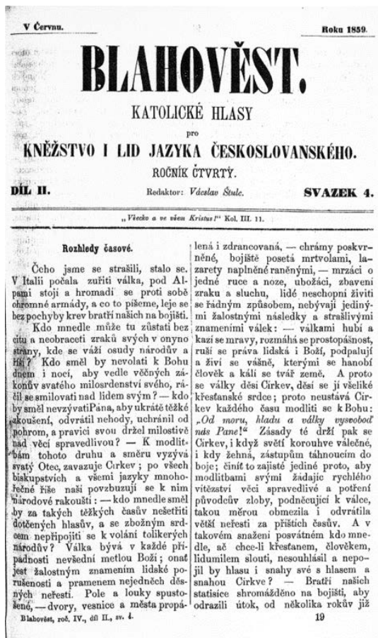
Titulní strana Blahověsta z roku 1859

nich“. 60 Když 26. března 1860 vydal Pius IX. apoštolský list Cum catholica Ecclesia , vyslovil se ve stejném duchu: Církev vzhledem ke svému poslání potřebuje nezávislost na světské moci. Vznik suverénního papežského státu v době po rozpadu římské říše se ukázal jako moudrá záležitost, díky níž papež disponoval politickou nezávislostí a mohl uplatňovat svou autoritu a pravomoc vůči celému světu. 61