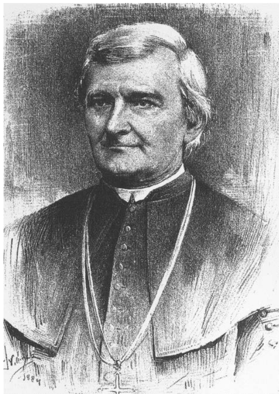
Václav Štulc (1814–1887)

ale Tvého jest potřebí nám. Než srdce nás vybízí, abychom před Tebou s úctou nejpokornější vyslovili, že k mnohým Tvým věrným synům počítati smíš také nás věrné Čechy. 93 Autoři textu do adresy zakomponovali i vzpomínku na Konstantina a Metoděje a jejich příchod na Moravu s ostatky papeže Klementa I. Vyjádřili tím, že české dějiny jsou s dějinami papežství od počátku spjaty a čeští věřící hodlají „ v jednotě s Římem navždy setrvati “. 94