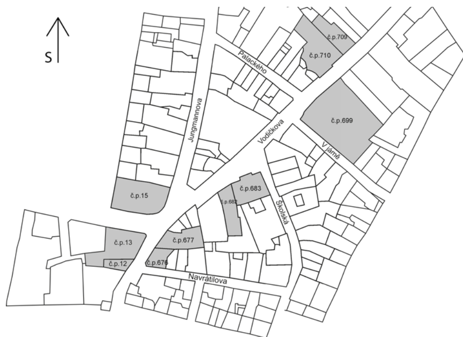
Obr. 8. Plán umístění jednotlivých domů s vyznačením těch, u nichž bylo na základě písemných pramenů zjištěno vlastnictví provozovatelů různých řemesel. Grafické zpracování K. Kozák.