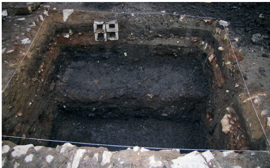
Obr. 2. Sonda v Jungmannově ulici, částečně vybraná organická výplň tvořená převážně koňským hnojem. Foto V. Wallis. Abb. 2. Sondierschnitt in der Jungmann-Str., überwiegend aus Pferdemist bestehende, teilweise ausgehobene organische Verfüllung. Foto V. Wallis.

S podobnou situací jsme se setkali při hloubení dalších šachet kolektoru v následujících letech. Dnešní prostranství ulic Vodičkova a Jungmannova se totiž z části nachází v místě středověké „Jámy“ – hluboké terénní deprese, zaplněné vodou a postupně se zanášející bahnem, jejíž hloubka i tvar se často měnily. Pod zlomem vedoucím od Zderazu až k Muzeu se nacházela ona Louže, Jáma či Palouk a nad svahek je území, které se nazývá „v ulici nad Járou“ (Lorenc 1973, 175) – in vico supra jamam (Tomek 1892, 53). Geologický vývoj této části Nového Města je stále předmětem intenzivního zkoumání (Zavřel 2014), a to nejen na základě poznatků získaných v rámci archeologických výzkumů převážně z let 2004–2008 (Selmi Wallisová–Otavská 2006).