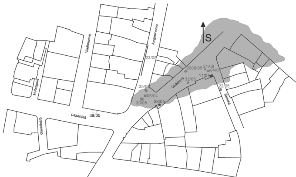
Obr. 3. Lokace jednotlivých sond v rámci výzkumu kolektorových šachet a rekonstrukce rozsahu „Jámy“ ve středověku na základě archeologického a geologického průzkumu. Podle Zavřel 2014.

Až do roku 2008 byl postupně proveden archeologický výzkum při hloubení šachet kolektorů na dalších jedenácti lokalitách v prostoru bývalého močálu (obr. 3). V rámci výstavby kolektorových šachet došlo k rapidnímu nárůstu archeologických bodů a zároveň se zde naskytla poměrně neopakovatelná možnost dostat se do hloubky při běžných záchranných archeologických výzkumech nedosažitelné (Selmi Wallisová 2009; 2009a; 2009b). Z hlediska archeologického poznání tyto výzkumy představují výjimečnou příležitost rekonstruovat nejen rozsah mokřiny a její postupný zánik, během něhož byla zaplněna komunálním odpadem, ale zejména široké spektrum vrcholně a pozdně středověké hmotné kultury Nového Města pražského.