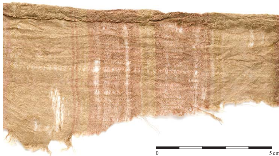
Obr. 7. Fragment barevně vzorované hedvábné textilie (1_V31_278) v plátnové vazbě.

Naprostou většinu všech archeologických textilních fragmentů z vrcholně a pozdně středověkého městského prostředí tvoří vlněné valchované i nevalchované tkaniny v plátnové vazbě s dostavou do 20 nití na 10 mm v osnově i útku, které je možné považovat za běžnou a široce používanou textilní produkci z místních dílen textilních řemeslníků (Tidow 2012, 98). Téměř naprostá absence textilních výrobků z rostlinných vláken není důkazem míry oblíbenosti určité