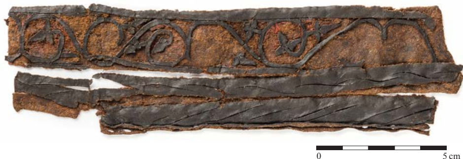
Obr. 4. Fragment usňového výrobku s plastickým vyřezávaným dekorem. Foto Z. Kačerová. Abb. 4. Fragment eines Ledererzeugnisses mit plastisch ausgeschnittenem Dekor. Foto Z. Kačerová.

Početně největší kolekce vyzvednutých artefaktů představují fragmenty textilií a usňových výrobků. Pozůstatky usní nebyly dosud podrobně zpracovány, podle zběžného průzkumu je zřejmé, že se v souboru nachází několik desítek téměř kompletních bot, několik set částí bot, pochvy na nože, rukavice, kusy brašen a pouzder, několik opasků a tisíce neidentifikovatelných odřezků. 3 Mezi nálezy vynikají luxusní fragmenty z pochev a jiných výrobků, které jsou zdobené jak řezbou do kůže, tak náročnou technikou odříznutí části povrchu kůže a následně polychromie vyřezaného plastického dekoru (obr. 4). 4