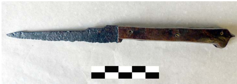
Obr. 5. Železný nůž s dochovanou dřevěnou rukojetí. Foto A. Havlínová. Abb. 5. Eisenmesser mit erhaltenem Holzgriff. Foto A. Havlínová.

formy na různé přezky a ostruhy. Jedinečným je soubor nožů, často i s dochovanými dřevěnými rukojetmi (obr. 5). Nálezy skla byly spíše sporadické, podmínky pro jeho uchování byly velmi špatné a sklo pravděpodobně podlešlo korozi. Patrně ze stejného důvodu se zde nenalezly ani žádné mince.