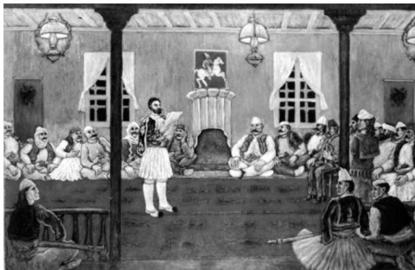
Doslova v poslední chvíli bylo na 10. června 1878 do Prizrenu svoláno celonárodní albánské shromáždění, které vstoupilo do historie jako Albánská nebo Prizrenská liga, aby před celou Evropou hájilo zájmy Albánců.