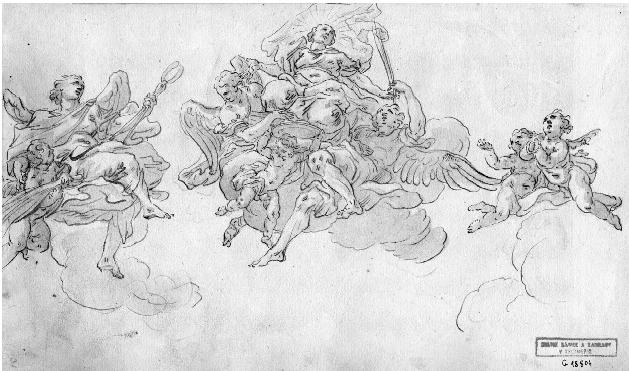
1 – Jan Jiří Etgens, Oslava sv. Agáty , lavírovaná kresba perem na papíře, album „Marat Icons“, 1726–1729. Muzeum umění Olomouc – Arcidiecézní muzeum Kroměříž