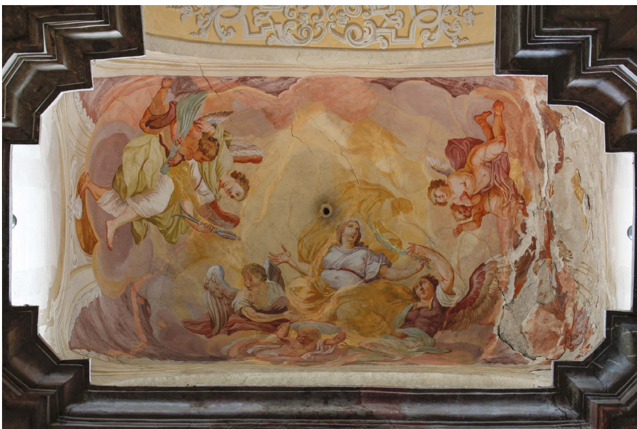
2 – Jan Jiří Etgens, Oslava sv. Agáty , nástěnná malba, 1726–1729. Rajhrad, kostel sv. Petra a Pavla, prostor pod jižní věží