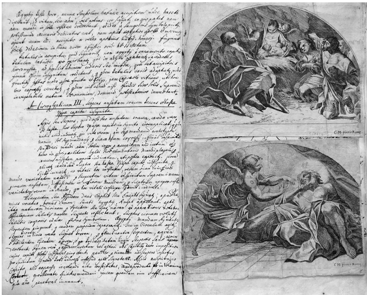
12 – Straussův rukopis, napravo překrytý dvěma grafikami, album „Marat Icones“, 1726–1729. Muzeum umění Olomouc – Arcidiecézní muzeum Kroměříž

Zbývá uvést ještě argumenty, jež by mohly být relevantní pro odmítnutí autorství italských malířů u kreseb v první polovině alba. 47 Odhlédneme-li od skutečnosti, že umělecký trh nenabízel, alespoň pokud je známo, použité skicáře, měl by existovat nějaký archivní záznam o koupi takové cennosti, jakým by skicář s kresbami Marattiho a Gaulliho bezpochyby byl. Jako člen konventu Strauss nedisponoval finančními prostředky, jeho italskou cestu financoval konvent a o svých výdajích Strauss informoval v dopisech opata. O pořízení skicáře s italskými kresbami by se jistě Strauss zmínil nebo by jej zaznamenaly klášterní diária či jiné prameny podobné jako například skutečnost, že si Strauss z Itálie přivezl část návrhů pro výzdobu klášterní knihovny. 48 A konečně, album