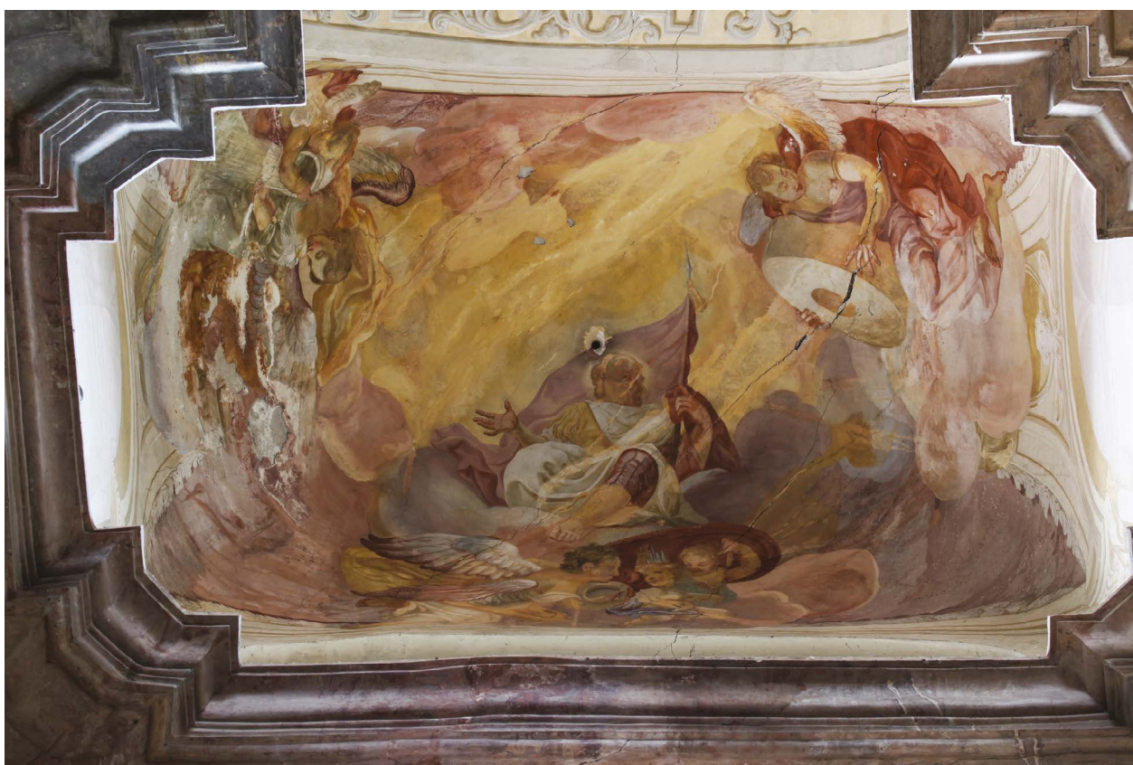
4 – Jan Jiří Etgens, Oslava sv. Floriána , nástěnná malba, 1726–1729. Rajhrad, kostel sv. Petra a Pavla, prostor pod severní věží