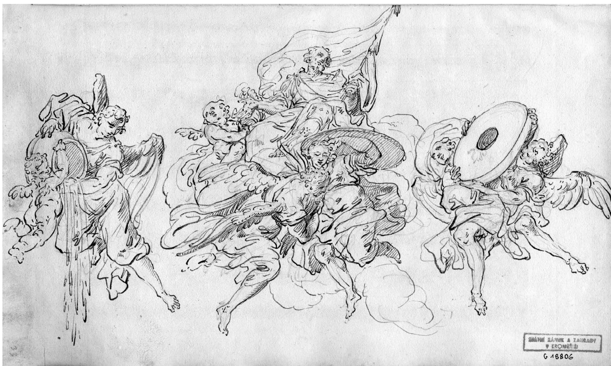
3 – Jan Jiří Etgens, Oslava sv. Floriána , kresba perem na papíře, album „Marat Icones“, 1726–1729. Muzeum umění Olomouc – Arcidiecézní muzeum Kroměříž