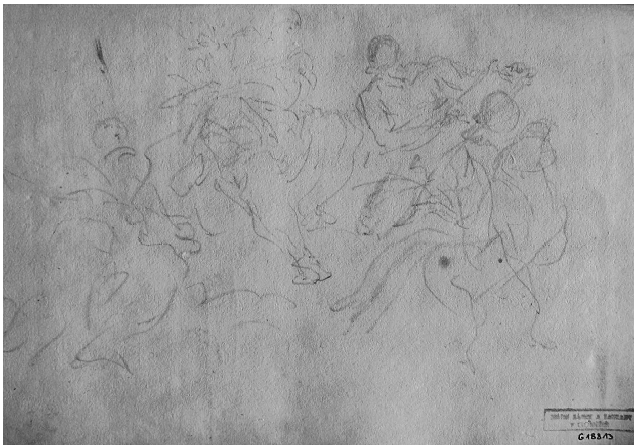
7 – Jan Jiří Etgens, Sv. Jeroným , kresba křídou na papíře, album „Marat Icones“, 1726–1729. Muzeum umění Olomouc – Arcidiecézní muzeum Kroměříž

některých grafik ve skicáři: jsou vybledlé, propíchané v rozích a znečištěné mušinci. Můžeme si tedy snadno představit, že dlouhodobě visely v malířské dílně. U jiných grafických listů jsou zřejmé stopy jejich užití jako předloh, nacházíme na nich rastr sloužící k přenosu celé kompozice nebo na rubové straně překreslení obrysů jedné vybrané postavy. 22 V této souvislosti připomeňme další s Etgensem spjaté album z grafické sbírky kroměřížského zámku, obsahující velkoformátové grafické listy, dodatečně oříznuté, nalepené a svázané v průběhu 19. století do podoby reprezentativního alba. Na deskách je uvedeno „ Imagines Aeri Incisae Studio Joan El[sic!]gens “. 23 Album je opatřeno původním titulním listem s nápisem „ Liber Secundus Imaginum Aeri Incisarum, Ioannis Georgii Etgens Pictoris Brunensis Studio, Romae et per Italiam Comparatarum “, pod nímž je připsáno kurentem „ Der 1te Theil von dieser Sammlung fehlt “. 24 Kromě tohoto alba je v Kroměříži uložen ještě jeden svazek s římskými vedutami Il nuovo splendore delle Fabriche in prospettiva di Roma moderna z roku 1686, v němž se nachází dokonce i Etgensův vlastnický přípis, datum pořízení a cena: „ Ex Libris Ioannis Etgens. 1727 per 7 fl. “. 25 Konečně, pořizování grafických alb, sbírání jednotlivých grafických listů i získání Straussova skicáře s texty a kresbami by dobře korespondo-