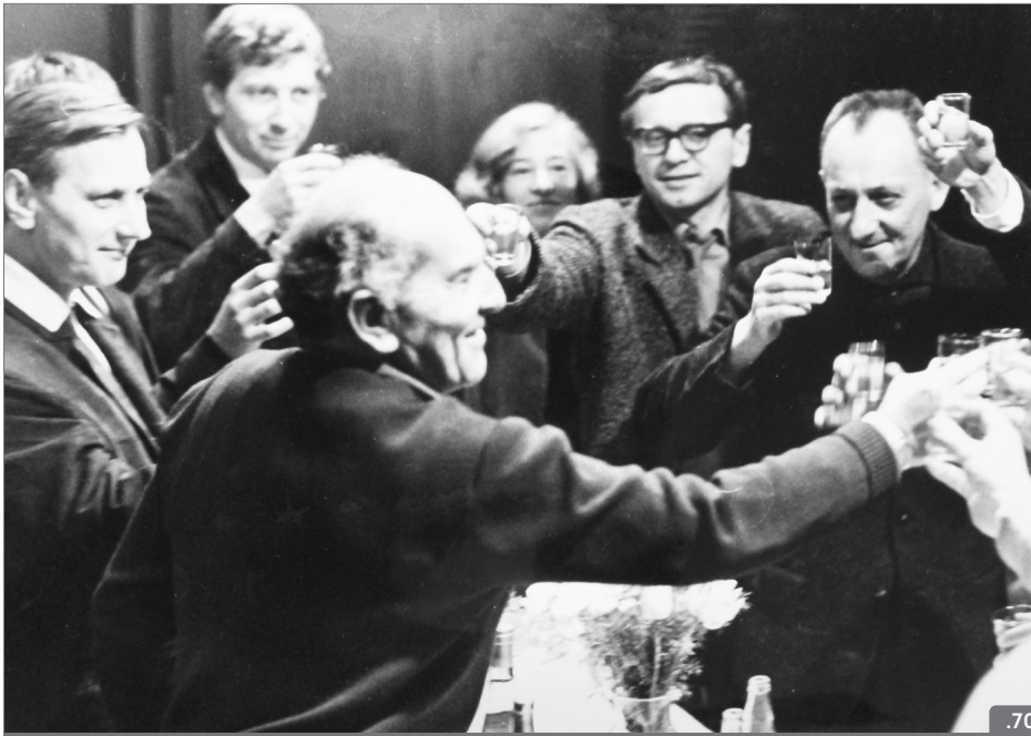
Oslava udělení titulu zasloužilý umělec (NM, divadelní oddělení, H6p-19/2013, Pozůstalost režiséra K. Nováka II., foto autor neznámý).

Vídni (1959), zúčastnil se jako pozorovatel dubrovnických her v Jugoslávii (1960) anebo vycestoval do Velké Británie na shakespearovské slavnosti (1961). Na období let 1966 a 1967 získal výjezdní doložky do Rakouska a Itálie, důvod vycestování není znám.