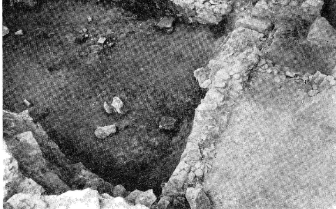
Obr. 4. Zemnice s vzdívkou ve středu zkoumané plochy. Vpravo vysunutá vstupní část. Pohled od jihovýchodu.

kostelem a které by patřily nejstarší středověké fázi lokality. Reálná je zatím možnost rozšíření výzkumu směrem k severu, kde v bezprostředním sousedství prozkoumané plochy A (obr. 1) dojde k demolici jižního křídla domu čp. 1216/II. Některé nezastavěné plochy dvorů by rovněž dovolovaly alespoň menší zjišťovací výzkumy. Nezbývá nám než doufat, že se tyto výzkumy podaří uskutečnit, aby bylo možno dospět ke komplexnějšímu pohledu na lokalitu.