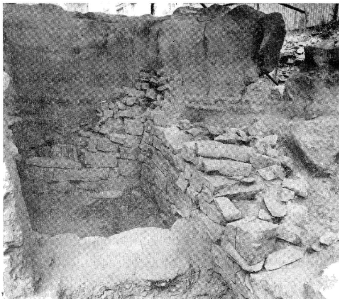
Obr. 5. Zemnice s pravidelným kamenným obložením u jihovýchodního nároží domu čp. 1216/II. Pohled od jihu.

sentierte Fundhorizont, die jedoch ebenfalls nach den bisherigen Datierungskriterien in das 13. Jh. gehören. Die weitere Untersuchung der Lokalität müsste sich vor allem auf die Feststellung des Flächenausmasses der Besiedlung mit besonderer Berücksichtigung der Objekte richten, die mit der romanischen, in die Mitte des 12. Jh. datierten Kirche zeitgleich sein könnten.