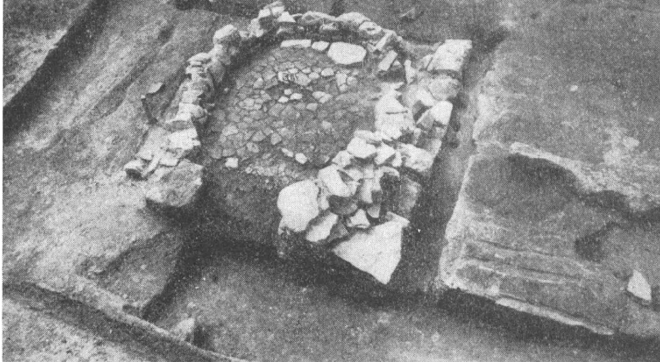
Obr. 1. Uh. Hradiště, Otakarova ul., obj. č. 10.

„Weichbildverfassung“. K definitivní ztrátě venkovského panství dochází však ve třicátých letech 14. stol., kdy se Kunovice stávají střediskem nevelké šlechtické domény (Verbík 1981, 102). Již v této době se nejbohatší měšťané zakupují v okolí, i když jediným sporným dokladem je vlastnictví Hluku Zdislavem Měščem doložené r. 1303 (CDM V, 149) 2 . Tato vrstva byla také zainteresována na výstavbě městského mlýna, k čemuž došlo k malé radosti cisterciáků před r. 1331 (CDM VI, 416). R. 1363 markrabí Jan odpouští měšťanům placení mýta v Čechách a na Moravě, uděluje mlóvé právo várečné a dva další výroční trhy (CDM IX, 322). Feudální vlastníci Starého Města a Kunovic se zde zřejmě pokoušeli obnovit a posílit některé výnosné živnosti, neboť r. 1378 privilegium markrabí Jošta znovu zakazuje krčmy a vaření piva v okruhu 1 míle a navíc i provozování řemesel. Obdobné zákazy obsahuje ještě privilegium krále Zikmunda z r. 1421 (Nisl 1920, 69, OAUH, i. č. 24).