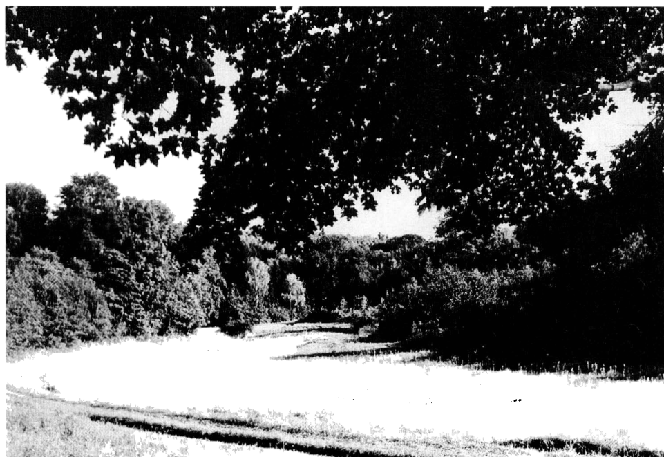
Obr. 3. Pohled do konůveckého údolí před započatím výzkumu na počátku 60. let.