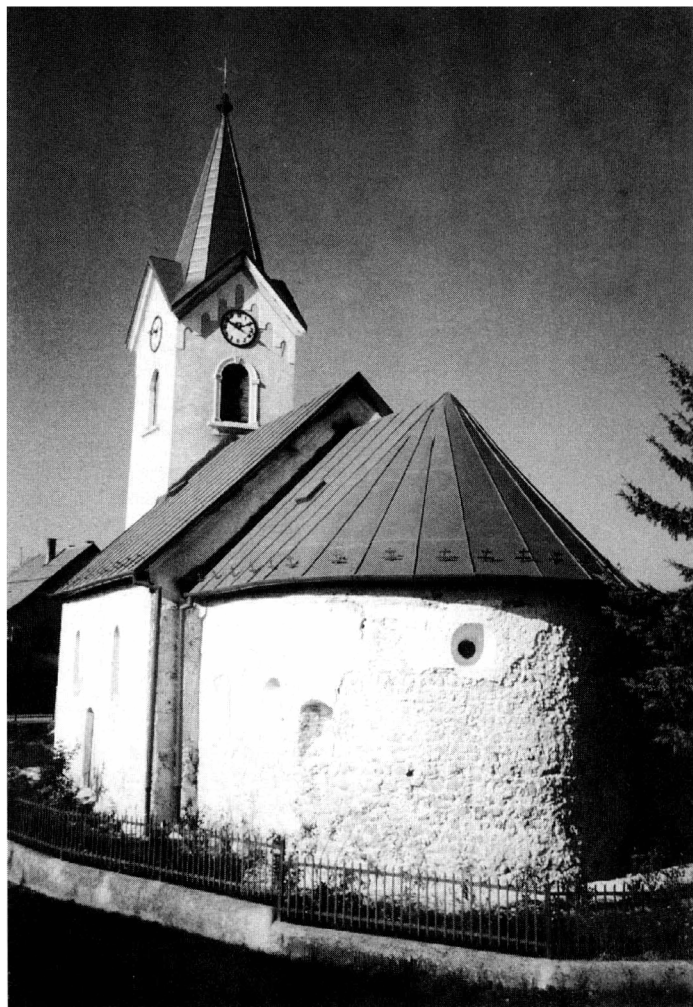
Obr. 3. Celkový pohľad na kostol v Timoradzi od juhovýchodu.