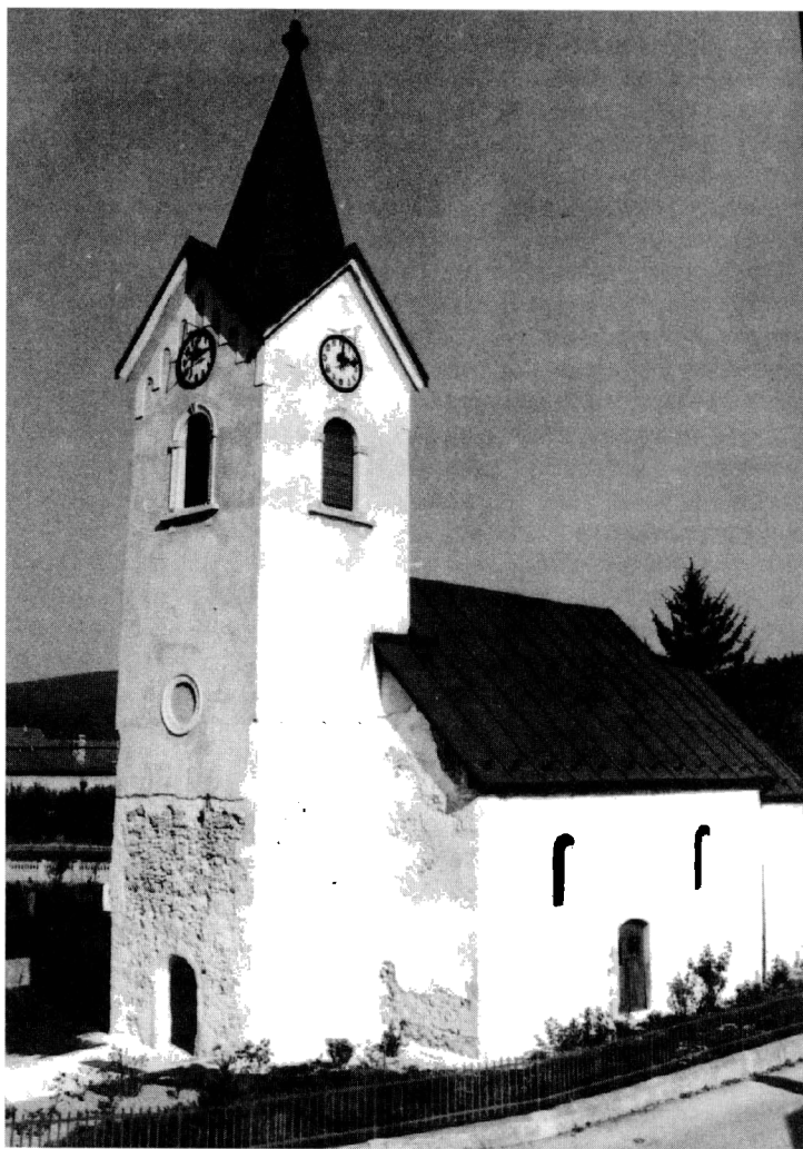
Obr. 1. Timoradza, celkový pohľad na kostol od juhozápadu.

v r. 1995 sa pri kopaní ryhy pre odvodňovací kanál okolo kostola narazilo na kostrový hrob, patriaci príkostolnému stredovekému cintorínu. Žiaľ hrob neobsahoval bližšie datovateľné sprievodné nálezy (Katkin 1997, 108, 243). 3 Skutočnosť, že sa obec spolu s ďalšími okolitými obcami hradnianskeho archidiakonátu nespomína v písomných prameňoch 13. stor. vysvetľujú historici tým, že v 13. stor. neprešla do rúk šľachticov (Lukačka 1985, 832). Nakoľko nie je uvedená ani v súpise pápežských decimátorov z r. 1332–37, 4 prvá zmienka o obci „Timoraz“ pochádza až z metácie v r. 1335 (Fekete–Nagy 1941, 195). Medzi r. 1295–1389 bola začlenená do Uhrovskeho hradného panstva, ktorého majitelia ju v priebehu 15.–1. pol. 16. stor. viackrát zálohovali drobným zemanom (Fekete–Nagy 1941, 195, 395; Wagner 1896, 115). História Parochiae uvádza, že Barbora, vdova po Andrejovi Dánffym, dala v r. 1501 v Timoradzi vystavať kostol spolu s farou, a to z vďačnosti za obhájenie svojich vlastníckych práv na Uhrovske panstvo (Hist. Parochiae, 29, 30, 32, 35). Tento bližšie nepodložený údaj sa zrejme vzťahuje na jednu z prestavieb kostola, ako to uvádza aj pamiatková literatúra (Súpis III, 282; VSOS, 162; Togner 1988, 104). Z uve-