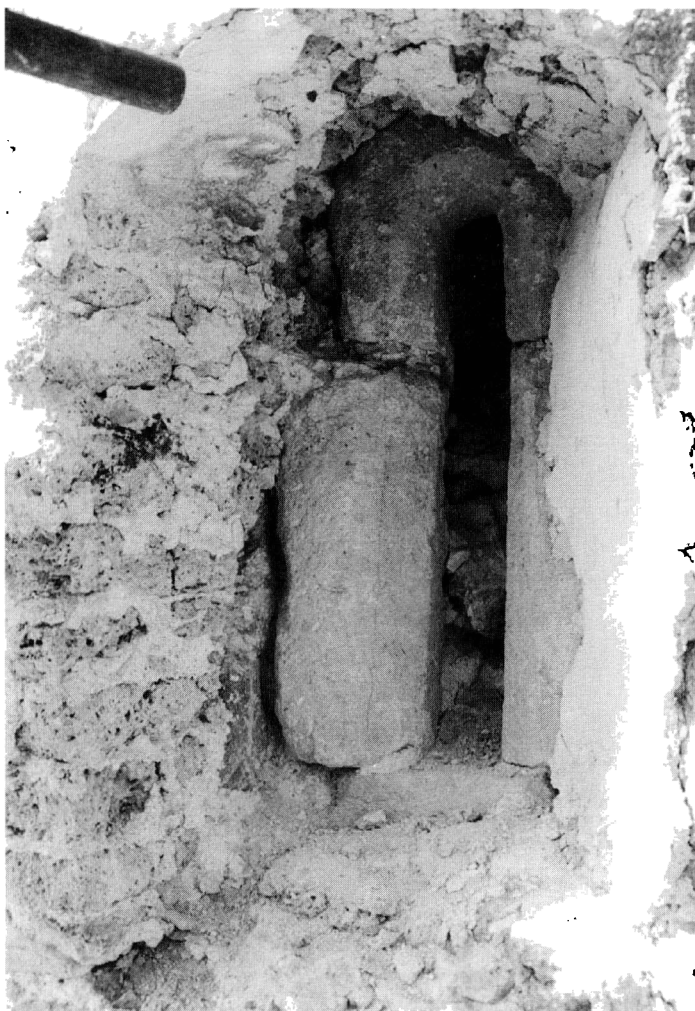
Obr. 4. Juhovýchodné ranorenesančné okno apsidy.

Lod' takmer štvoruholníkového pôdorysu s vonkajšími rozmermi 10,5×9,5 m si na severnej fasáde nezachovala žiadne stopy, naznačujúce prítomnosť pôvodných okien. Zato stopy ľahov štetcom v náterovej vrstve pôvodnej omietky, zachovanej v susedstve neskorých upravených špaliet dvoch okien južnej steny lode, nám nepriamo preukazujú prítomnosť pôvodných dvoch okien na južnej fasáde. Stopy svojím