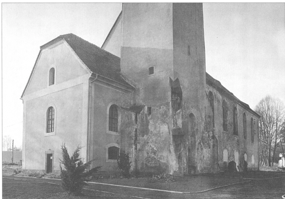
Obr. 2. Kostel sv. Ducha ve Višňové, pohled na presbytář a část věže s lodí od severovýchodu.