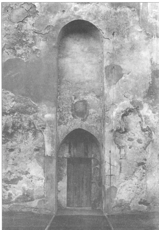
Obr. 3. Kostel sv. Ducha ve Višňové, detail vstupu do podvěží od severu, foto R. Kurša.