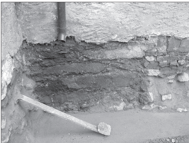
Abb. 5. Nordöstliche Ecke der gotischen Festung.