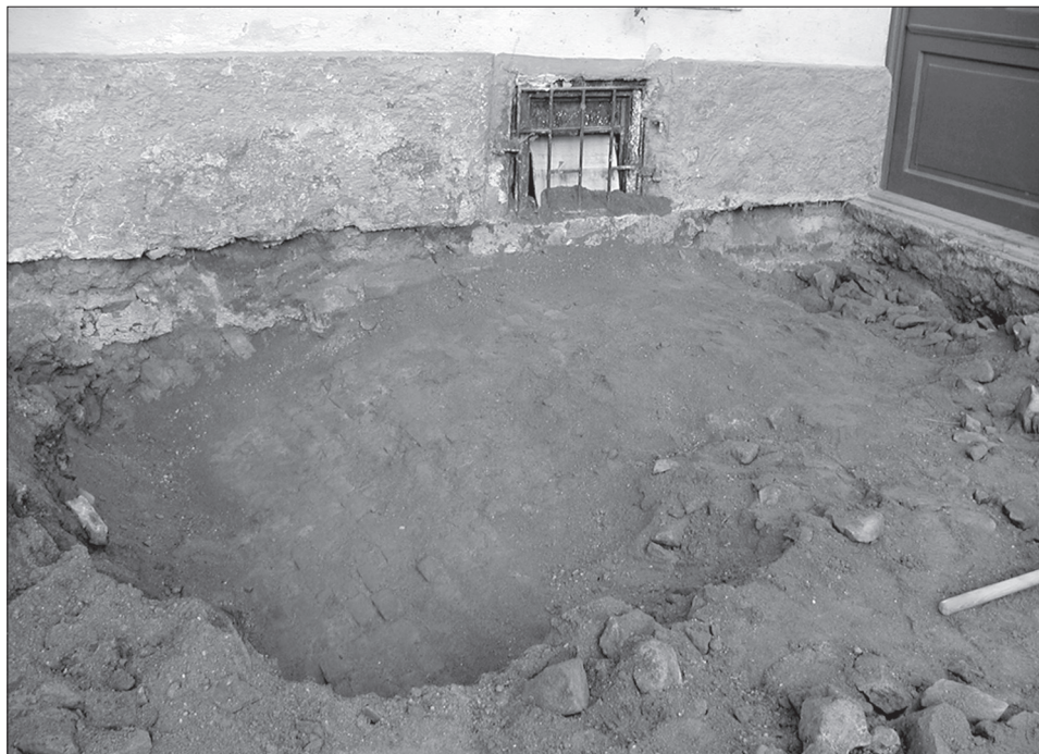
Obr. 6. Destrukce barokní cihelné klenby v jihovýchodním rohu nádvoří.