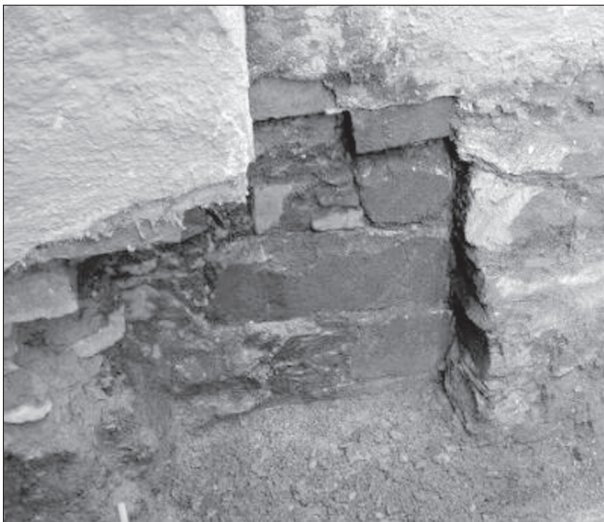
Obr. 4. Jihovýchodní nároží paláce gotické tvrze.