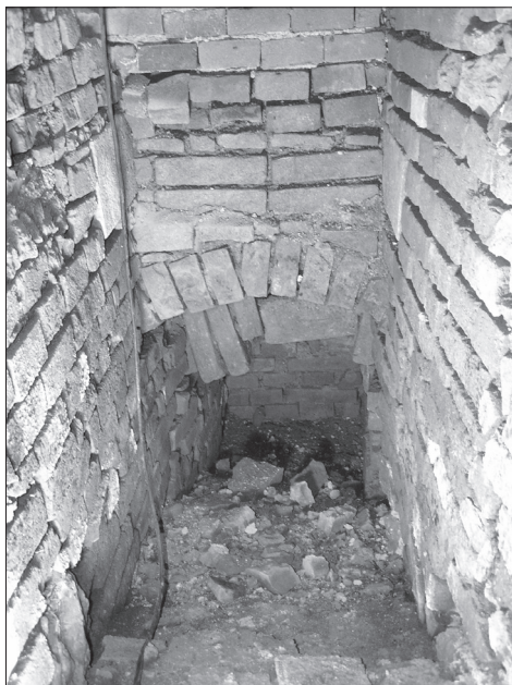
Obr. 8. Severozápadní nároží severního křídla zámku, pohled do nově otevřeného severního zakončení chodby, rok 2008.