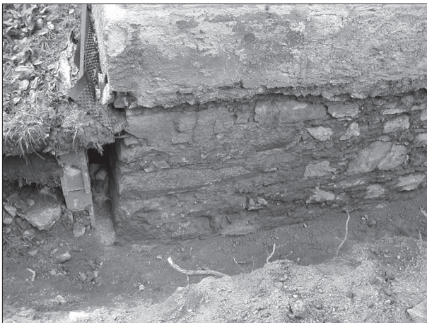
Obr. 5. Severovýchodní nároží gotické tvrze.