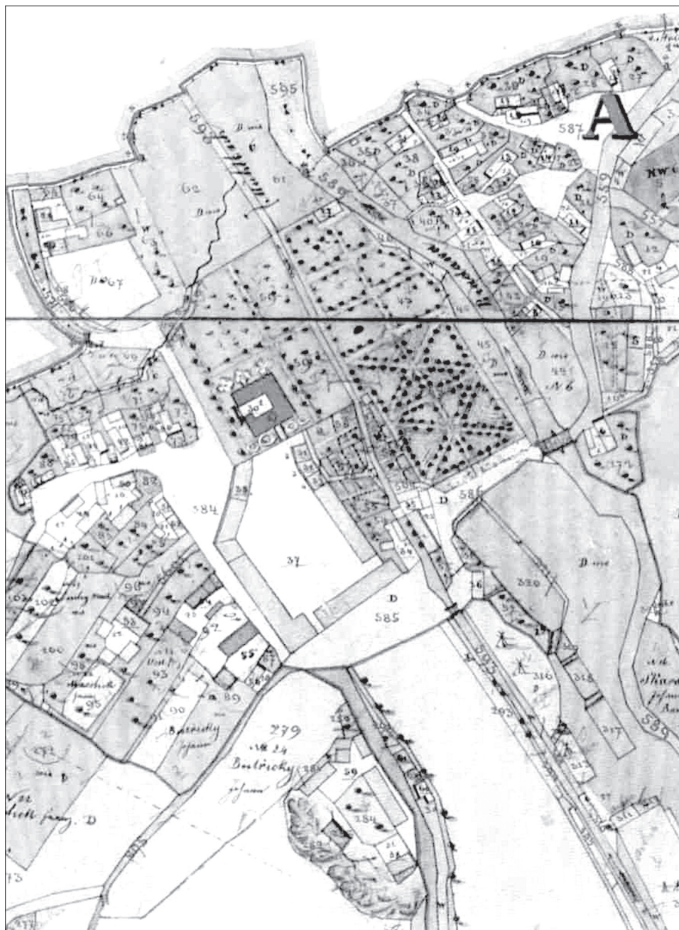
Obr. 1. Hradiště u Blovice, situace trojkřídlého zámku obklopeného parkem na mapě stabilního katastru z roku 1838.

Abb. 1. Hradiště bei Blovice, Situation des von einem Park umgebenen dreiflügeligen Schlosses auf einer Karte des Stablen Katasters aus dem Jahr 1838.