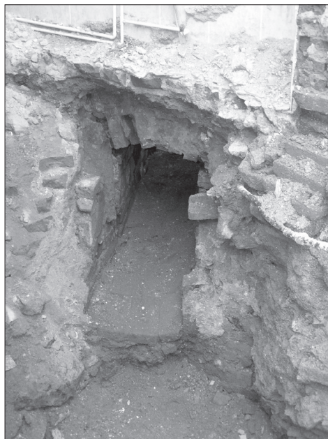
Obr. 7. Chodba k vybirání sazí a čištění komínových průduchů z prostoru nádvoří, první polovina 19. století. Foto J. Bouda. Abb. 7. Gang zur Rußentnahme und Reinigung der Kaminlüftungskanäle aus dem Hofraum, 1. Hälfte 19. Jhdt. Foto J. Bouda.