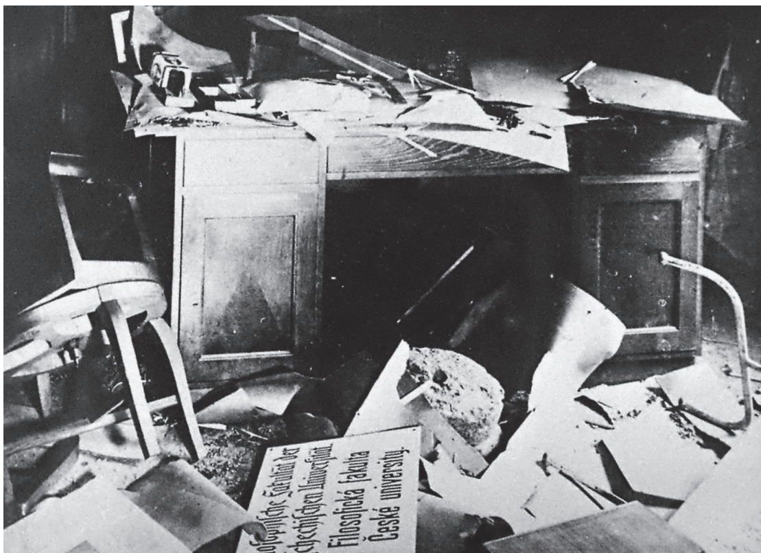
Poválečný stav budov fakulty