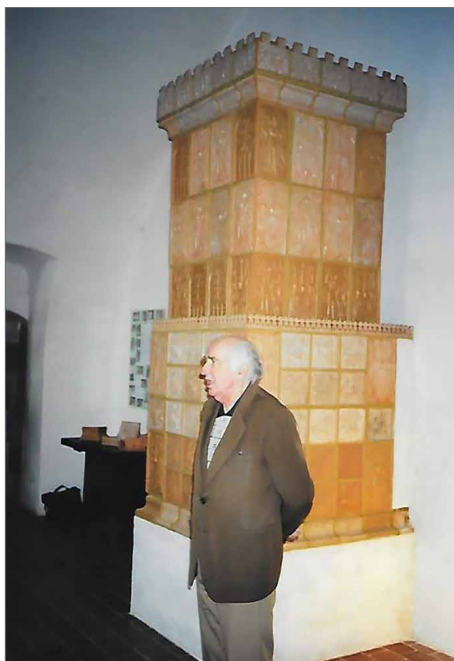
Obr. 7. Slavnostní vernisáž u příležitosti odhalení repliky pozdně gotických kachlových kamen ve 2. patře velké věže Státního zámku Lipnice nad Sázavou, 2. 9. 2000.