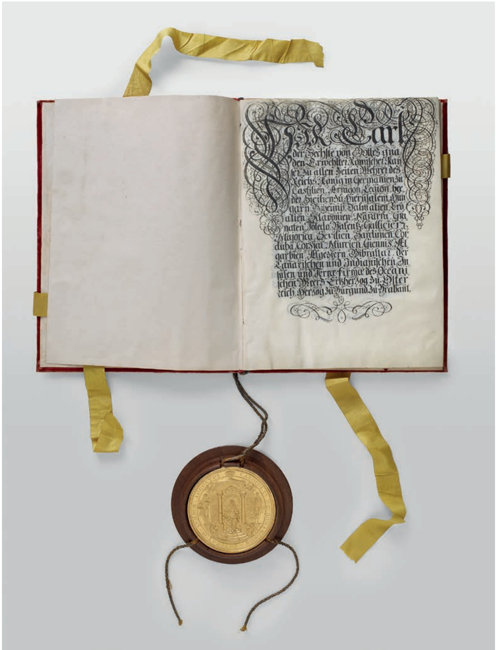
Kaiser Karl VI. vereinigt am 23. Januar 1719 die Grafschaft Vaduz und die Herrschaft Schellenberg und erhebt sie zu einem reichsunmittelbaren Fürstentum mit dem Namens „Liechtenstein“. Ausf. Wien, 1719 Januar 23, AT-HAL, U