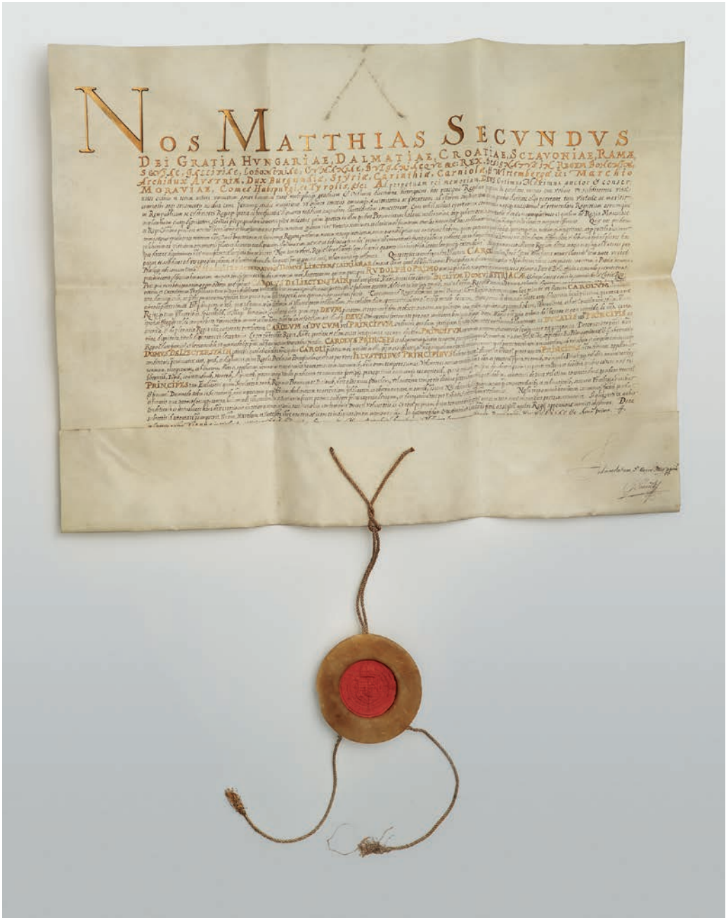
König Matthias erhebt am 20. Dezember 1608 das Haus Liechtenstein in den Fürstenstand.