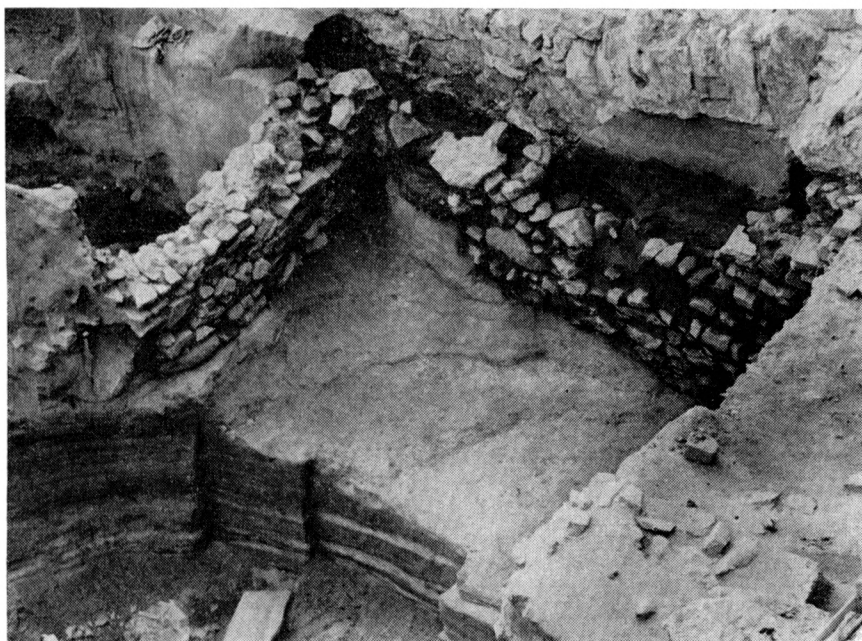
Obr. 3. Zemnice s vyzdívkou v severozápadní části zkoumané plochy Pohled od severovýchodu.

Další výzkum by se měl zaměřit především na vymezení plošného rozsahu osídlení, se zřetelem k objektům, které by mohly být současné s románským