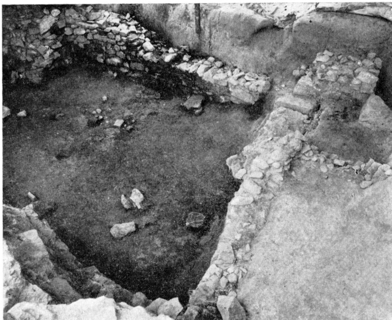
Obr. 4. Zemnice s vyzdívkou ve středu zkoumané plochy. Vpravo vysunutá vstupní část. Pohled od jihovýchodu.

kostelem a které by patřily nejstarší středověké fázi lokality. Reálná je zatím možnost rozšíření výzkumu směrem k severu, kde v bezprostředním sousedství prozkoumané plochy A (obr. 1) dojde k demolici jižního křídla domu čp. 1216/II. Některé nezastavěné plochy dvorů by rovněž dovolovaly alespoň menší zjišťovací výzkumy. Nezbyvá nám než doufat, že se tyto výzkumy podaří uskutečnit, aby bylo možno dospět ke komplexnějšímu pohledu na lokalitu.