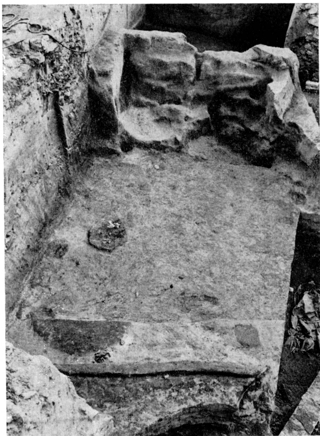
Obr. 2. Zemnice bez vyzdívky v severozápadní části zkoumané plochy. V pozadí stupňovitě upravený vchod. Pohled od severu.

Archeologický výzkum, prováděný v této oblasti Pražským střediskem státní památkové péče a ochrany přírody, byl zahájen r. 1969 na staveništi Ústřední celní správy (obr. 1—A). 1 Mimořádným porozuměním investora bylo možno prozkoumat poměrně rozsáhlou plochu. Zjištění, učiněná na této ploše, byla doplněna dalšími akcemi, víceméně záchranného charakteru, na staveništi Automatické telefonní ústředny Těšnov (obr. 1—C), při stavbě telekomunikačních tras (obr. 1—B) a při přeložkách inženýrských sítí.