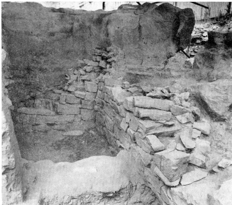
Obr. 5. Zemnice s pravidelným kamenným obložením u jihovýchodního nároží domu čp. 1216/II. Pohled od jihu.

sentierte Fundhorizont, die jedoch ebenfalls nach den bisherigen Datierungskriterien in das 13. Jh. gehören. Die weitere Untersuchung der Lokalität müsste sich vor allem auf die Feststellung des Flächenausmasses der Besiedlung mit besonderer Berücksichtigung der Objekte richten, die mit der romanischen, in die Mitte des 12. Jh. datierten Kirche zeitgleich sein könnten.