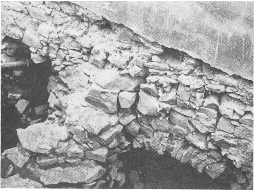
Obr. 3. Východná strana opevnenia Trojičného námestia.