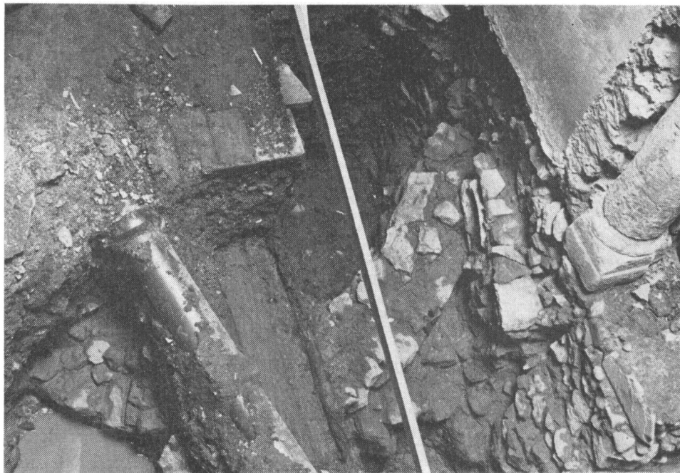
Obr. 2. Hutnická pec v nádvorí objektu č. 20.