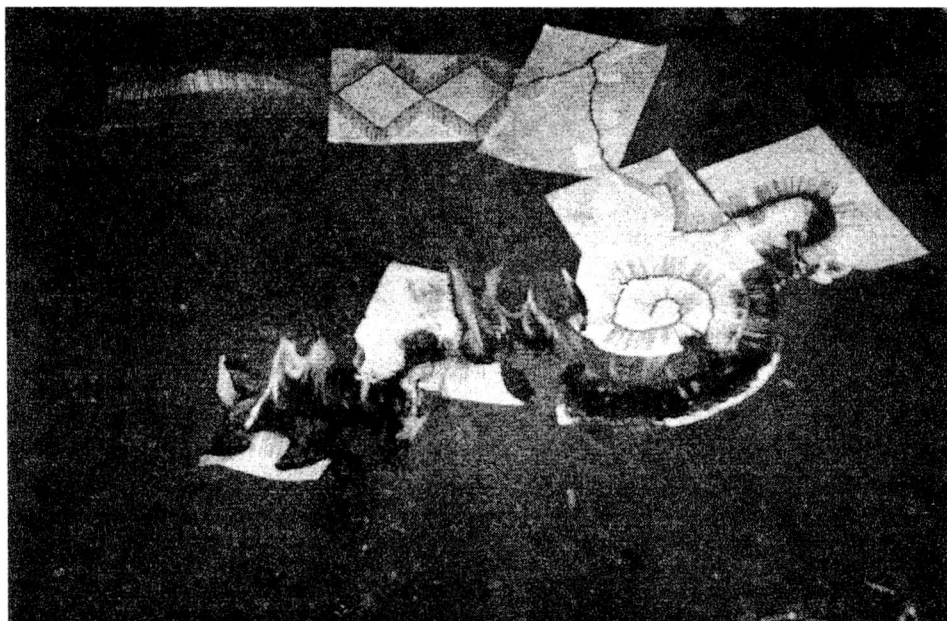
Bild Nr. 2: Aktionskunst — brennende Streichhölzerzeichen.