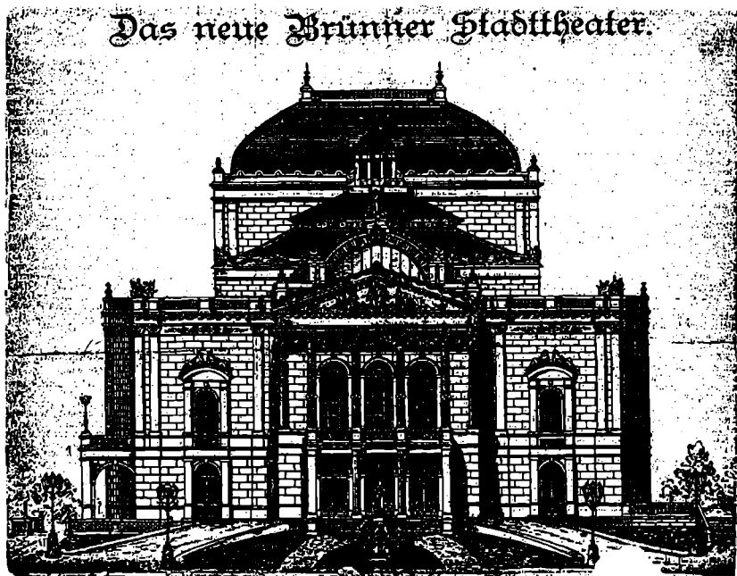
První představa o vzhledu Brněnského městského divadla. Obrázek uveřejněný v tisku 24. července 1881, týden poté, co byl položen základní kámen.