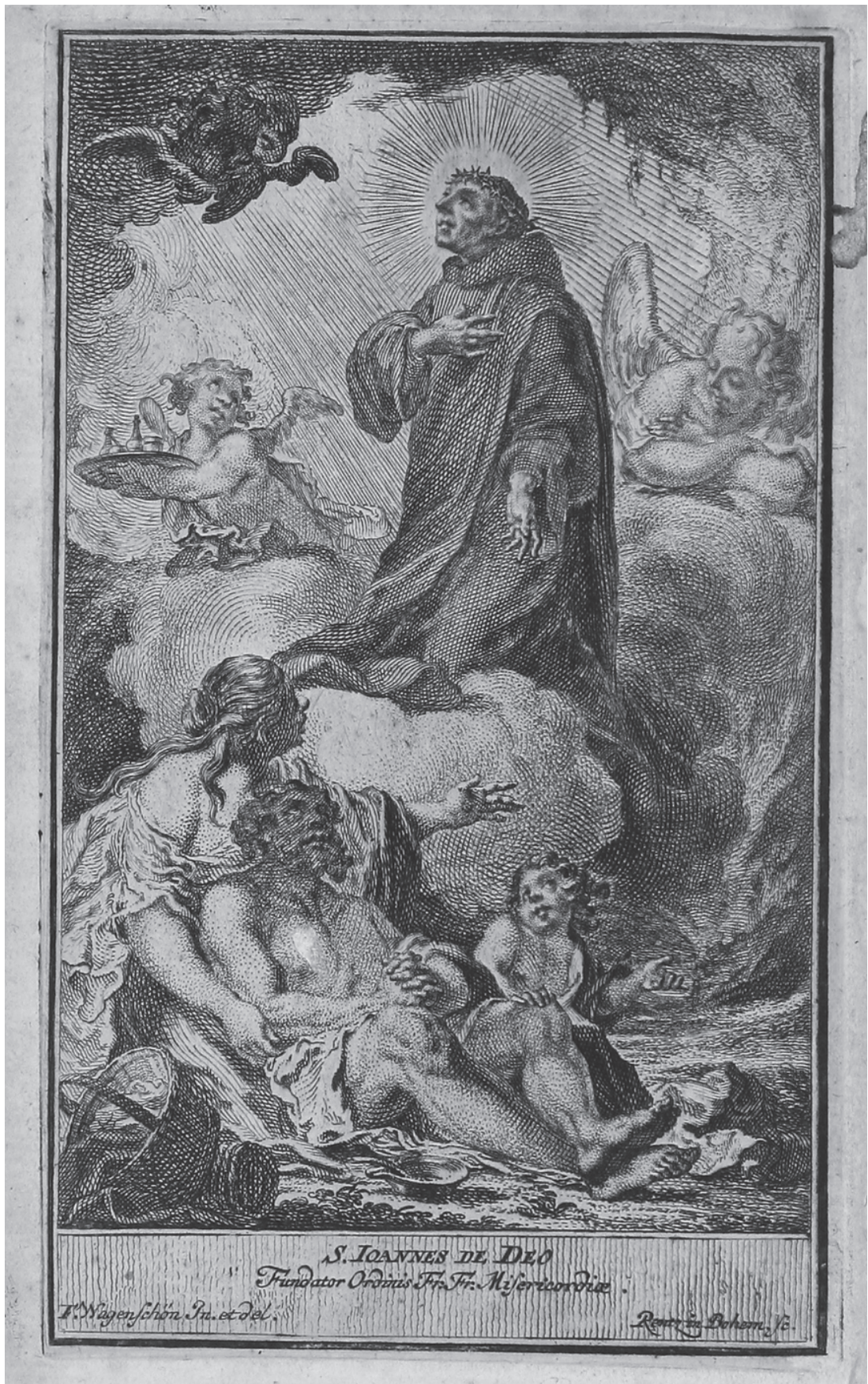
S. IOANNES DE DEO Fundator Ordinis Fr. Fr. Misericordiae.