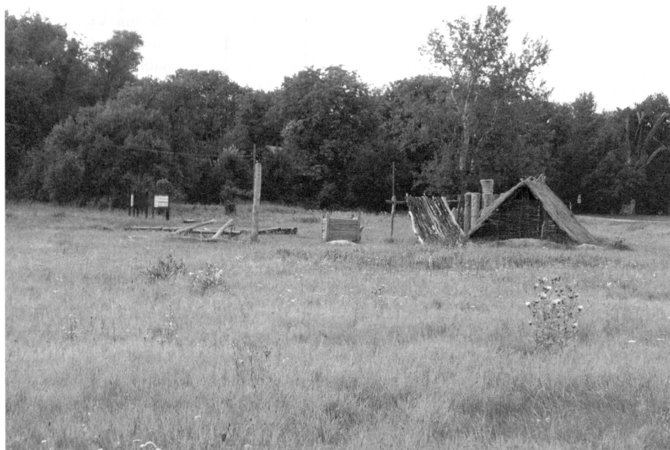
Obr.4. Rekonstrukce objektů nalezených při archeologických výzkumech na Pohansku

tvem. Přilepšovali si též pěstováním zemědělských plodin a byli podporováni z centra Velkomoravské říše (Vignatiová 1992).