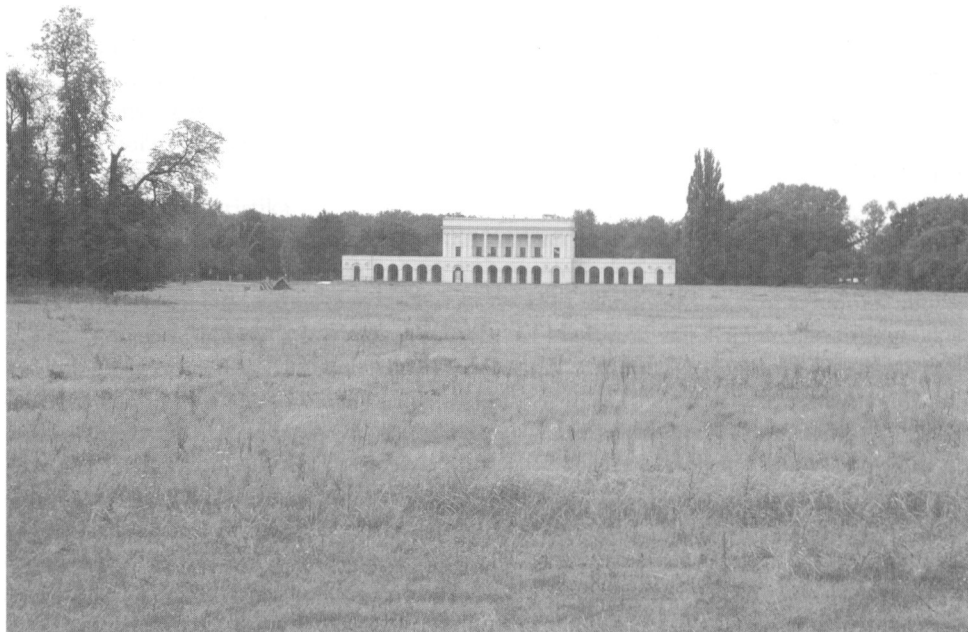
Obr.1. Pohansko, pohled na prostor hradiska v současnosti

započat sondážemi koncem 80. let 20. století Bořivojem Dostálem. Rozsáhlý výzkum byl proveden až v letech 1999 – 2004 Jiřím Macháčkem. Na této lokalitě bylo kromě objektů objeveno 34 kostrových hrobů a jeden pohřeb koně. Zajímavé jsou nálezy studny a palisádového plotu. Ucelená analýza této lokality dosud nebyla publikována (Macháček 2005a). V oblasti žárového pohřebiště se v současnosti nacházejí rekonstrukce několika objektů nalezených na Pohansku, je to rekonstrukce obydlí, kultovního objektu a studny (obr.4).