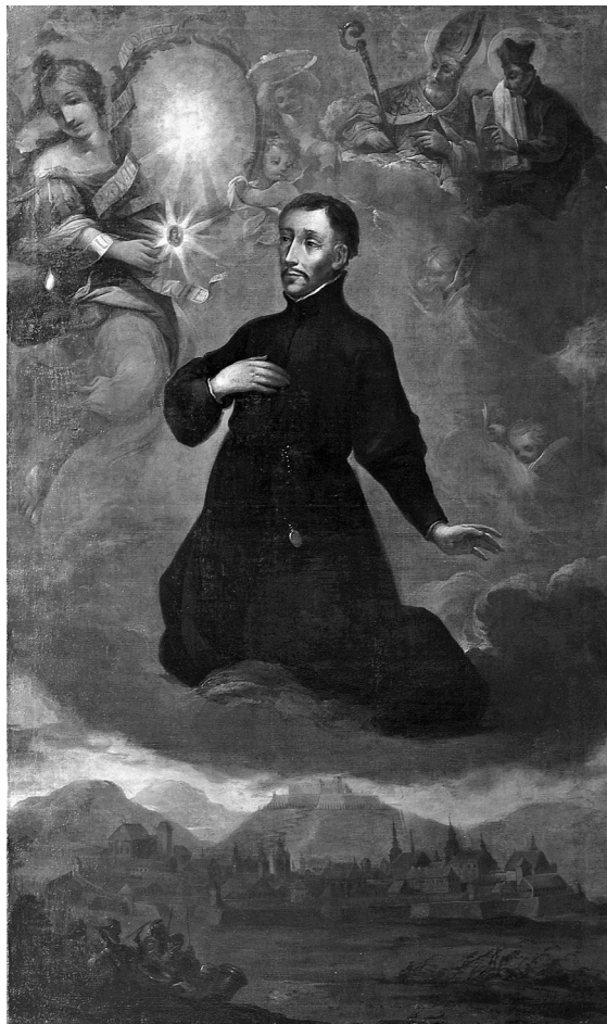
Obr. 6. Anonymní malíř 17. století, Martin Středa jako ochránce Brna, Brno, poslední třetina 17. století (?), olej, Moravská galerie v Brně.

Domus Iae [primae] probationis Soc. IESU Brunae bis Rector. “