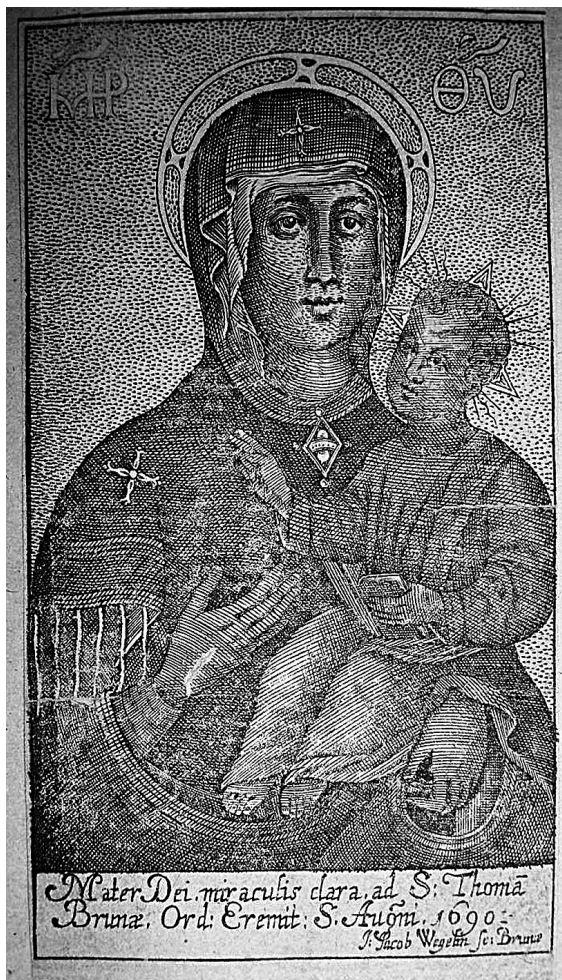
Obr. 1: Johann Jacob Wegelin, Panna Marie Svatotomská, Brno 1690, mědiryt, Národní galerie v Praze.

nost určit jej jako univerzitní tezi, chybí ale další pro teze typické znaky. 4 Rovněž není pravděpodobné, že rytina náležela k Arbo-rellově nedochované knize Arca foederis, Archa Umluwy, aneb Správa o obraze Matky Boží u Swatého Tomáše w Brnie (1684/1686). Jisté je, že takto nákladná dedikační rytina byla objednána k významnější události. Snad list vznikl u příležitosti jednoho ze slavnostních příjezdů olomouckého biskupa do Brna na jednání zemského soudu a sněmu. 5 Dominantní část kompozice zabírá znázornění