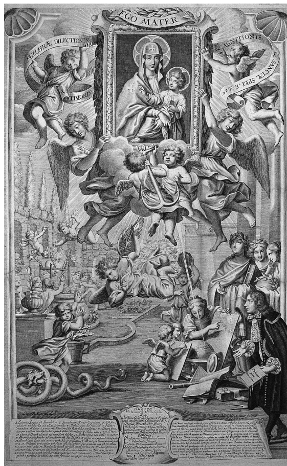
Obr. 2: Leonhard Heckenauer podle Martina Antonína Lublinského, univerzitní teze Lorenze Bontzera, Oslava Panny Marie Sněžné, Olomouc 1686, mědiryt, Olomouc, Zemský archiv Opava.

nost určit jej jako univerzitní tezi, chybí ale další pro teze typické znaky. 4 Rovněž není pravděpodobné, že rytina náležela k Arbo-rellově nedochované knize Arca foederis, Archa Umluwy, aneb Správa o obraze Matky Boží u Swatého Tomáše w Brnie (1684/1686). Jisté je, že takto nákladná dedikační rytina byla objednána k významnější události. Snad list vznikl u příležitosti jednoho ze slavnostních příjezdů olomouckého biskupa do Brna na jednání zemského soudu a sněmu. 5 Dominantní část kompozice zabírá znázornění