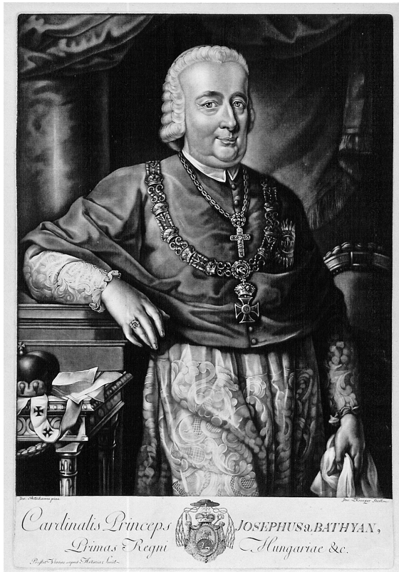
Abb. 1: Joseph Pitschmann – Joseph Kreuzer, Kardinal Joseph Batthyány, Primas von Ungarn, Mezzotinto, nach 1780, Galéria mesta Bratislavy.

ihm vorgelegt werden müssen um seine Bewilligung zur öffentlichen Publizierung zu erlangen. 16