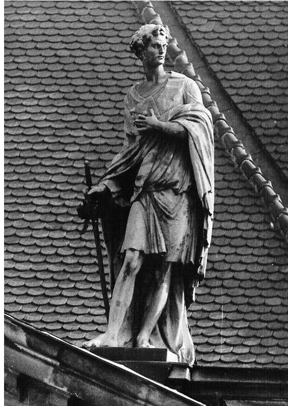
Abb. 7: Matthäus Kögler, Verdienst, Sandstein, 1779–1780.

hat – eine Haltung die schon das 19. Jahrhundert vorzeichnet.