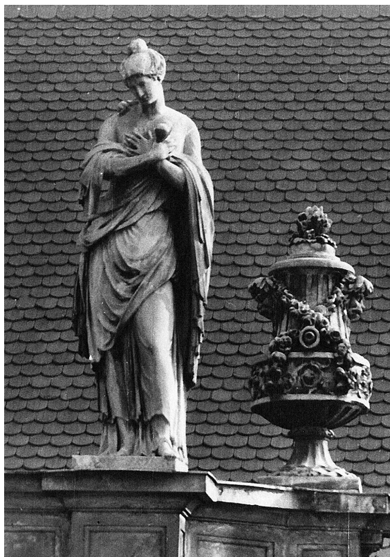
Abb. 8: Matthäus Kögler, Reinheit des Herzens , Sandstein, 1779–1780.

beiden Armen auf eine Säule. Damit ist sie die Personifikation der Standhaftigkeit, so wie sie üblicherweise dargestellt wird. 65 Nicht üblich ist dagegen ihre Verbindung mit der zweiten ähnlich gestalteten weiblichen Figur, die zu ihren Füßen sitzt. Sie ist nämlich die Gottesgelehrtheit , d. h. die Theologie. Diese hat zwar ihre aus Cesare Ripa bekannten Attribute, einen Sternglobus und ein Rad, 66 nimmt aber keine dominierende Position mehr ein. 67 Sie richtet ihr Gesicht auch nicht zum Himmel, so wie es bei dieser Gestalt sonst üblich war, sondern zu der erwähnten, über ihr stehenden Figur der Standhaftigkeit, die ihr in dieser aktuellen, der damaligen Situation entsprechenden Interpretation den verdienten Halt gibt.