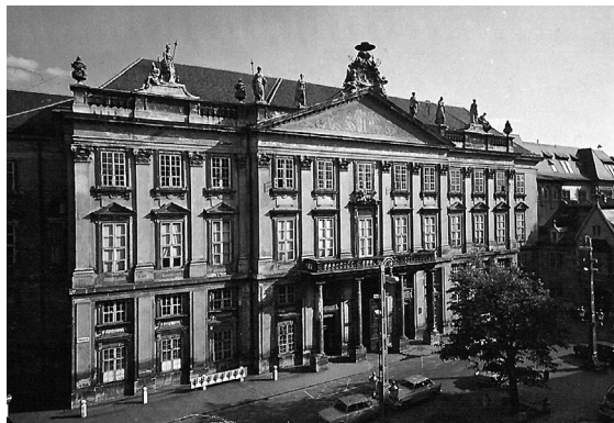
Abb. 2: Melchior Hefele, Primatialpalais in Preßburg (Bratislava), 1778–1781.

gefunden wurde, ist ein Vertrag mit dem Maler Franz Anton Maulbertsch, über den wir aus anderen Quellen wissen, dass er im Giebel der Fassade Figuren malte. 29