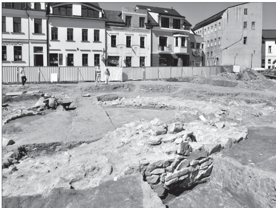
Obr. 3. Zachytené murivo kruhovej veže – pohľad z východnej strany.