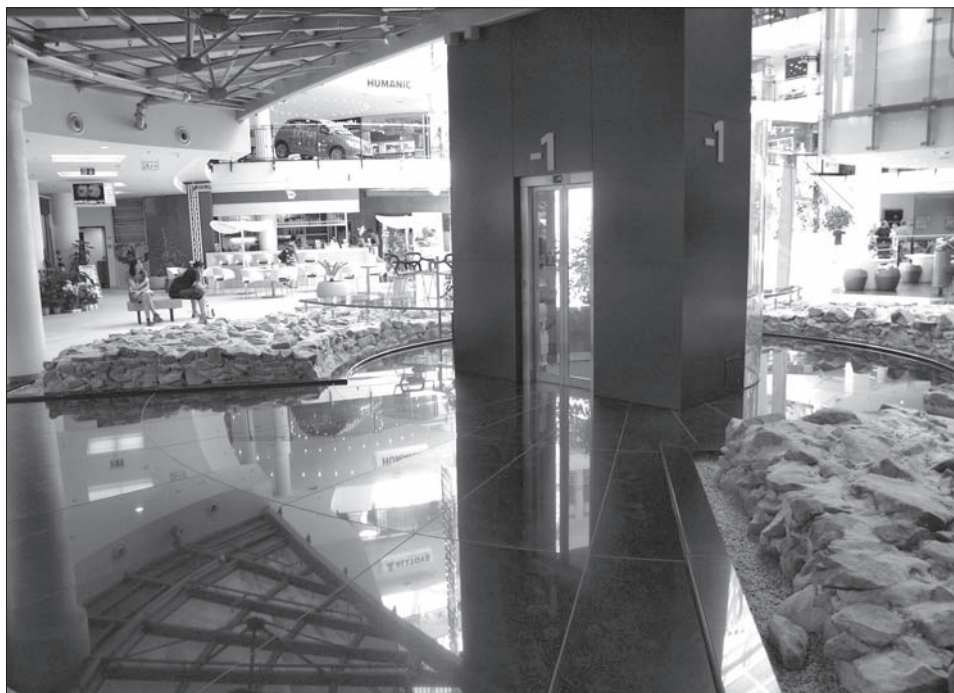
Obr. 5. Prezentácia základov kruhovej veže – pohľad z úrovne -1. podlažia.