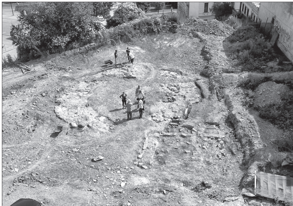
Obr. 2. Skúmaná plocha – pohľad zo západnej strany.