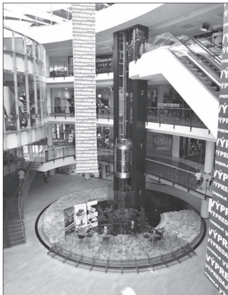
Obr. 4. Prezentácia základov kruhovej veže – pohľad z 0. podlažia.

Za jeden z argumentov, ktorý sa uvádza proti interpretácii veže ako Žilinského hradu, možno považovať časť zmienky z roku 1397, kde sa hovorí o poškodenom hrade „ popri ňom “ alebo „ neďaleko “ mesta, nie však „ v ňom “ sa nachádzajúcim (Marsina 2009, 9; Moravčík 2009, 19). V tomto prípade však bol hrad istým spôsobom od jadra mesta dispozične oddelený, čo vidno i na zachovanej parcelácii, kde je areál „hradu“ a farského kostola vyčlenený z inak pravidelnej zástavby mesta. Chýbajúci opevňujúci prvok samotného areálu hradu, pokiaľ bol na mieste dnešného obchodného centra Mirage, mohol byť zničený úpravami terénu a intenzívnymi stavebnými prácami (inžinierske siete) v priestore ulice Horný val. Ďalšou možnosťou je, že zachytenú vežu začali stavať ako súčasť opevnenia, ktoré sa nezrealizovalo