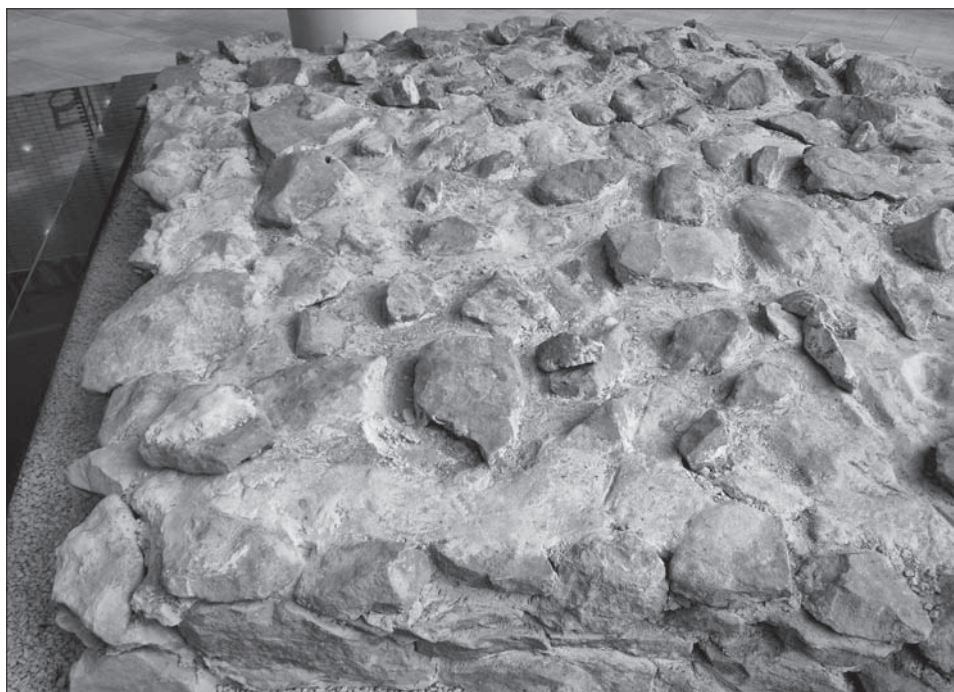
Obr. 6. Detail prezentovaného muriva v obchodnom centre Mirage.