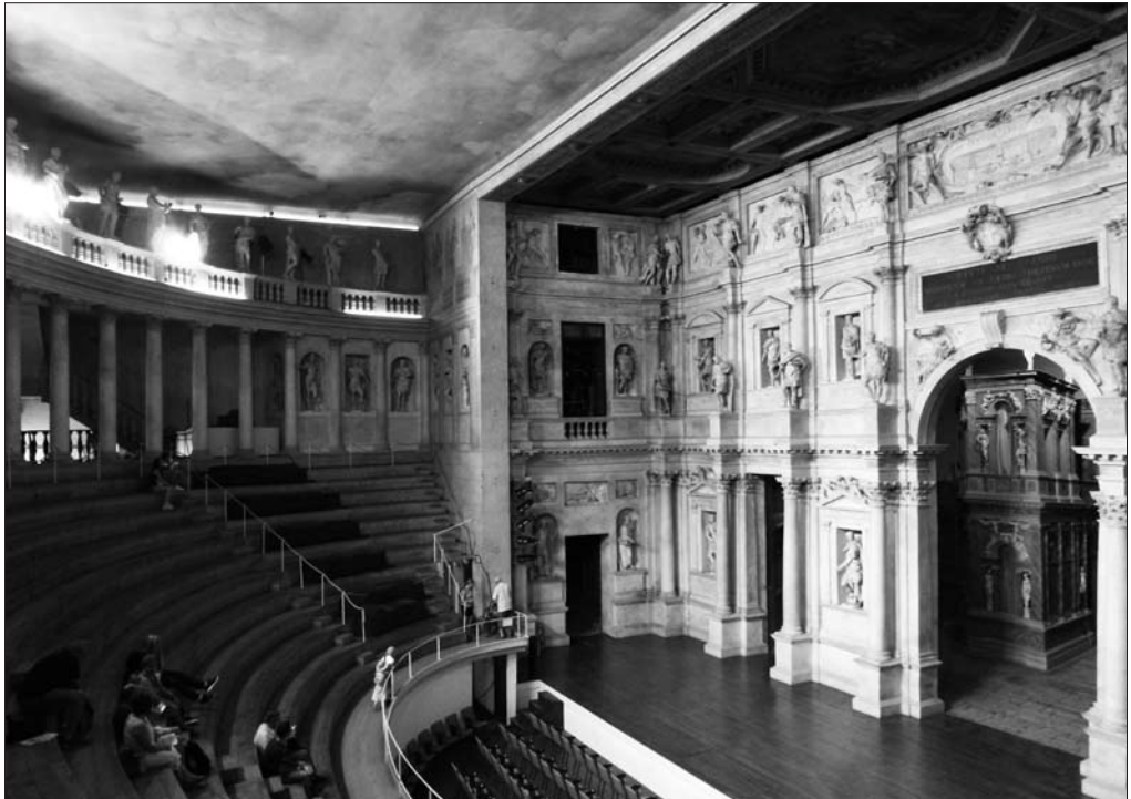
Obr. 2: Teatro Olimpico.

architektonických principů, z nichž je utkán ideální obraz návratu k antice, této utopie promítnuté do minulosti. G. V. Pinelli, současník, který se však premiéry nezúčastnil, napsal, že toto mohutně vypadající divadlo je vlastně „Il teatro troppo piccolo“, příliš malé divadlo (GALLO 1973: 59). Deklarovaná kapacita 5000 (nebo 3000?) diváků byla nejspíše silně nadsazená.