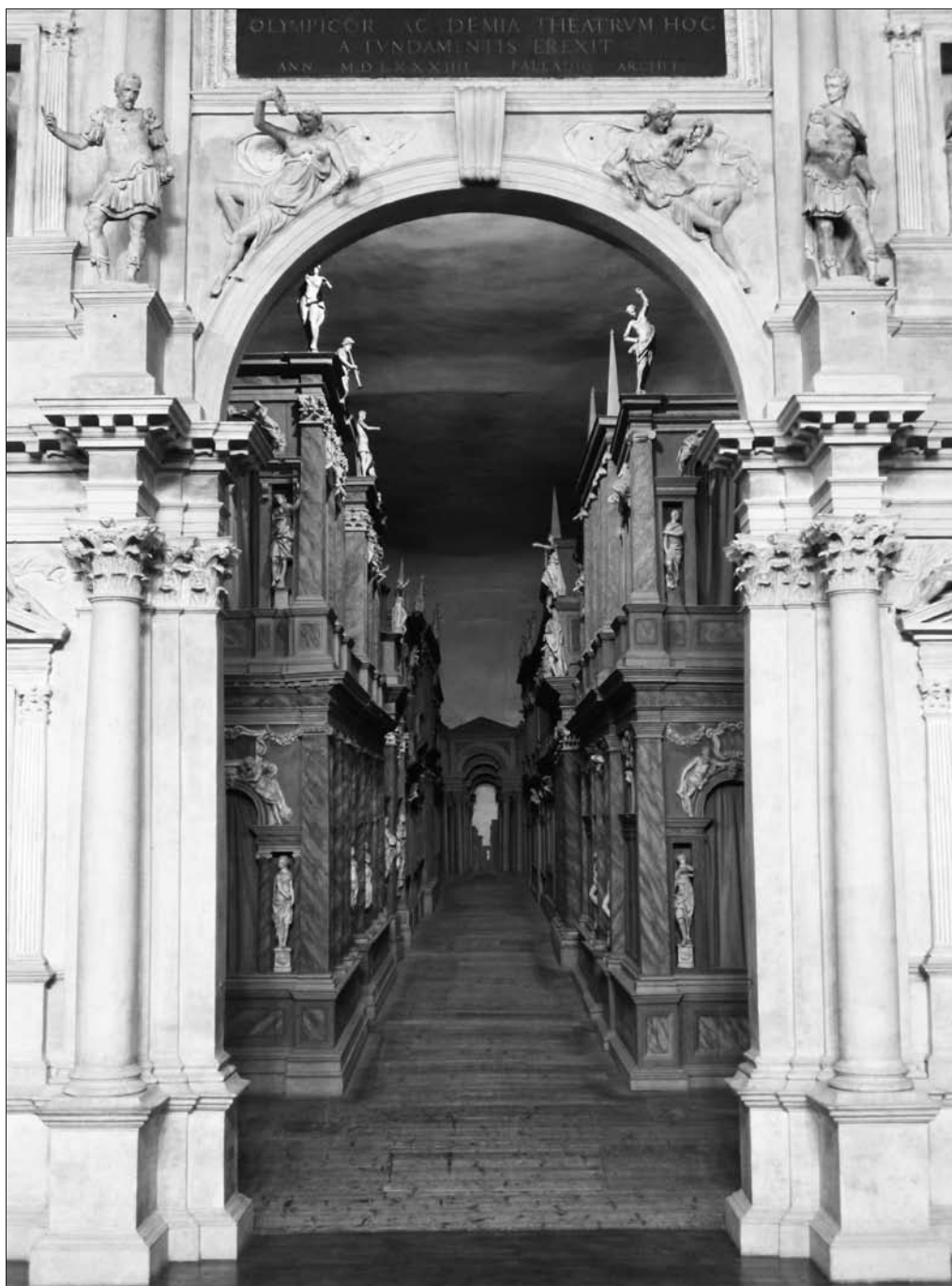
Obr. 1: Průhled do Scamozziho „thébské“ ulice.