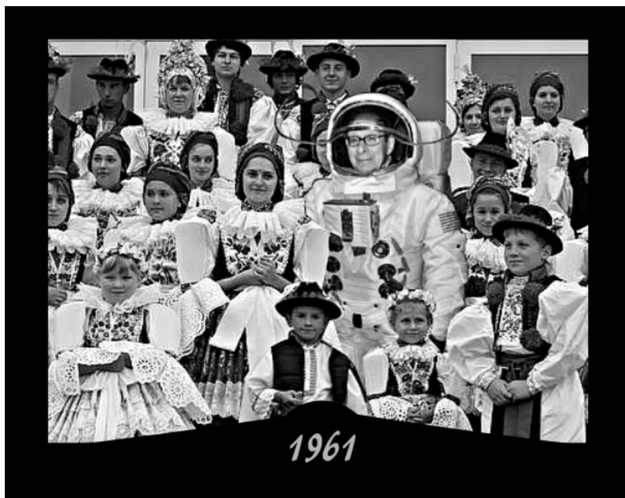
Známa momentka, na níž se Garfinkel druží s domorodci v místní hospodě. Fotografie byla publikována se svolením jejího autora, majitele Slováckého dvora.

Edmund Husserl by si nikdy nebyl sto představit, jakého pokroku dosáhne jeho koncept přirozeného světa díky Garfinkelově usilovné práci v Ostrožské Nové Vsi. Alfred Schutz sice už dříve Husserlův filosofický koncept obrátil sociologicky z hlavy na nohy, ale Garfinkelovy inovace znamenaly obrovský průlom v možnostech empirického etnografického nakládání s přirozeným světem lidské každodennosti a s vykazováním etnometodologických analýz.