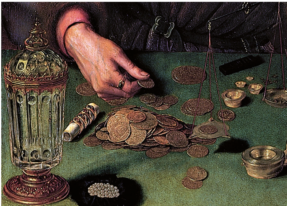
Obr. 1: Detail obrazu Směnárník se svou ženou, Quentin Massys (1456/1466–1530), 1514, Musée du Louvre Paris