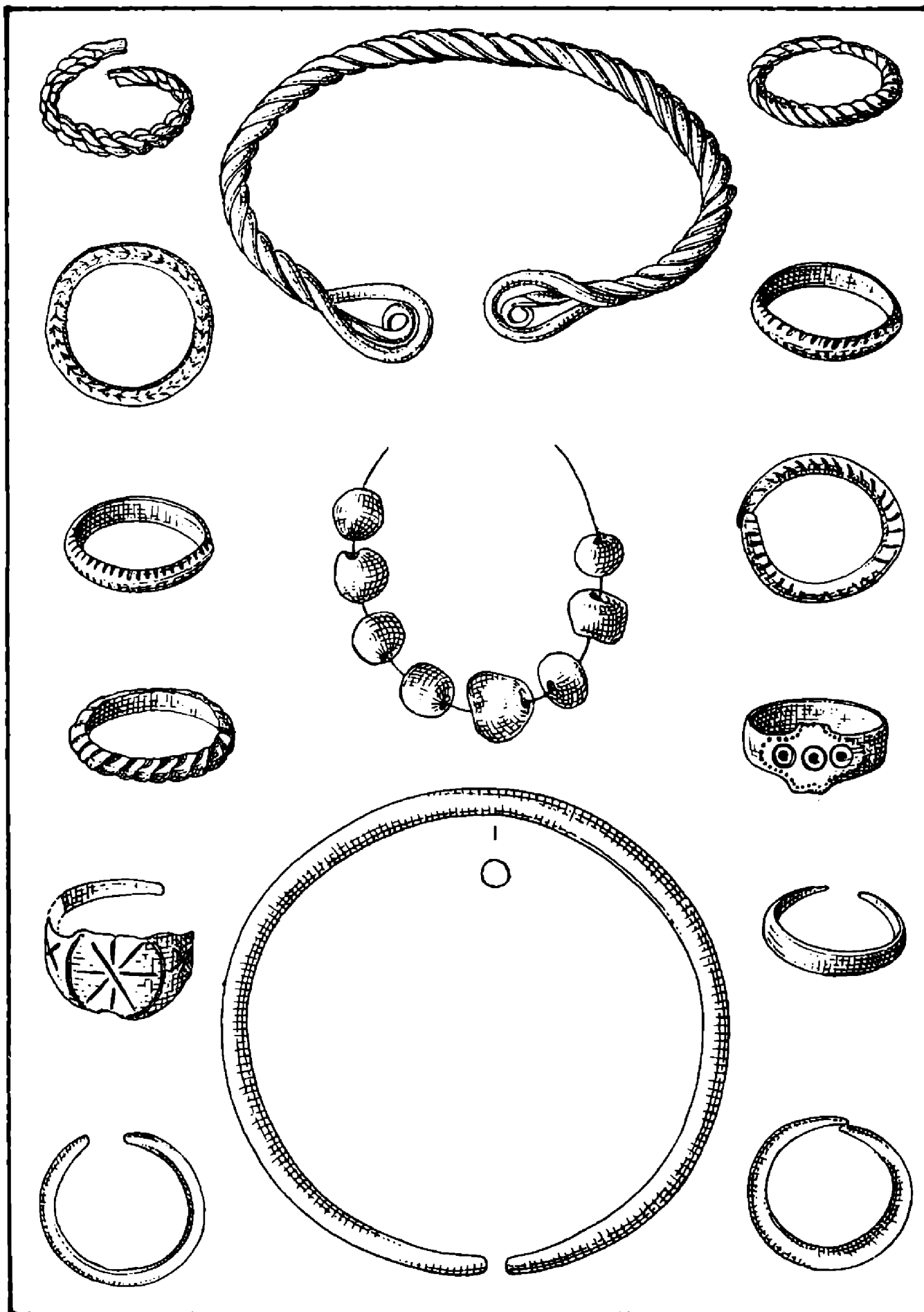
Ob. 2. Čokajovce. Výber nálezov z hrobov (10.–11. storočie).