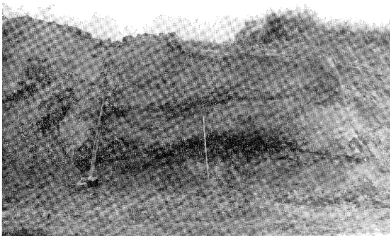
Obr. 1. Obilná. Středověký objekt od V z cesty v profilu výkopu.