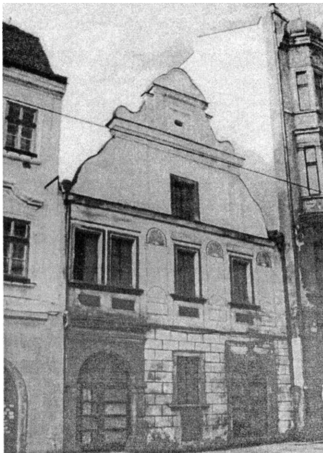
Ol>r. I. Plzeň (p. 89, hlavní průfili.