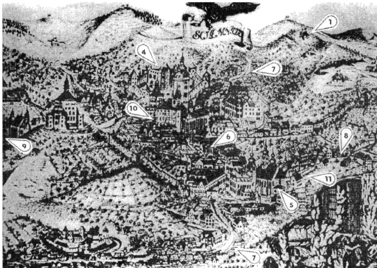
Obr. 2. Banská Štiavnica. Reprodukcia medirytiny C. T. Della Martina z roku 1764. 1–8, 11 – najvýznamnejšie stavebno-prístorové objekty z územia stredovekého mesta (označenie objektov podľa obr. 1).

jú. Využitie murovaných objektov, zachytených výskumom B. Pollu (1958) na opačnej strane tangovanej plochy, sa dá interpretovať opäť viacerými spôsobmi. Mohlo ísť o objekty na bývanie i skladovanie vyťaženej rudy či iných prevádzkových zásob. Pamiatky hmotnej kultúry vymedzujú chronologický rámec osídlenia tohto areálu na úsek 13.–15. stor. (Labuda 1990, s. 69).