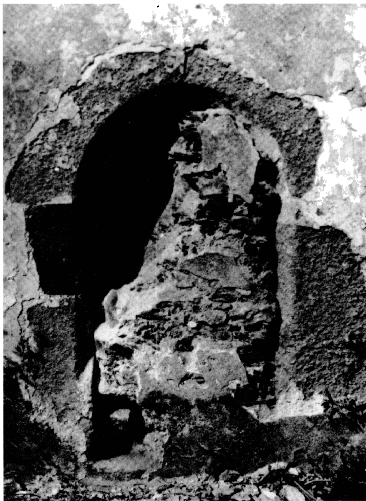
Obr. 3. Kamenný portál južnej fasády. Foto a kresby: M. Bóna.

riér lode doplnili murovanou emporou, nesenou stlačeným klenbovým pásom. O niečo neskôr, na sklonku 19. stor., si rodina Tarnóczyovcov na svahu juhových. od kostola vybudovala dodnes zachovanú monumentálnu rodinnú hrobku v klasicizujúcom slohu.