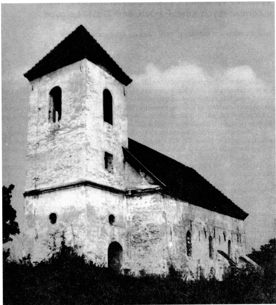
Obr. 1. D. Leľovce, r. k. kostol – pohľad od juhozápadu.

dvoch vrstiev nástenných malieb a jazva vo východnom okraji steny, ktorá určovala predpoklad odtrhnutého ústupku napojenia uzáveru kostola. Tento, ako aj ďalší predpoklad románskeho resp. ranogotického pôvodu stavby, vychádzajúci z charakteru povrchovej úpravy omietky a z fragmentov malieb, potvrdil aj archeologický výskum. Zisťovacie sondy v interiéri kostola obnažili časti základových murív jednolodového kostolíka s apsidou polkruhového, mierne predĺženého pôdorysu, v strede so základom pre oltárnu podnož. Nájdené zvyšky murív dovoľujú rekonštruovať rozmery interiéru lode štvoruholníkového pôdorysu 4,8×4,8 m a šírku apsidy: 3,1 m. Podľa rovnomerného spodného ukončenia interiérovej omietky v sev. murive a na oltárnej podnoži je zistiteľná niveleta pôvodnej podlahy, ktorá sa nachádzala 60 cm nad úrovňou súdobého vonkajšieho terénu. Základy apsidy boli zapustené po skalnaté podložie do hĺbky 77 cm. Takýto pôdorysný typ románskeho