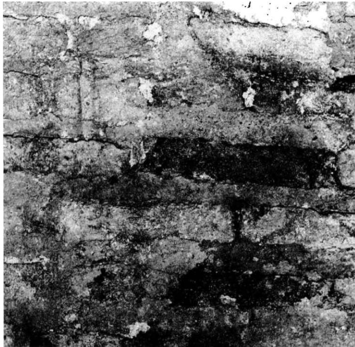
Obr. 2. Tehlové murivo so škárovaním v chóre.