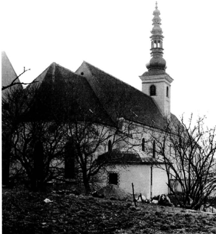
Obr. 1. Trnava, bývalý kostol klarisiek, pohľad zo severovýchodu