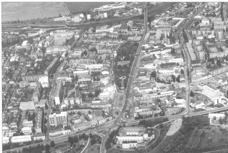
Obr. 1. Historické jadro Zvolena, pohľad od juhu.

Pravdepodobne najstaršiu radnicu zo slovenských miest má Bratislava, keď v roku 1387 od dedičov bývalého richtára Jakuba bola odkúpená časť domu pre potreby radnice. Tento dom ešte v súkromnej držbe richtára Jakuba niesol meno „pretorium“. V nasledujúcom 15. stor. mesto od dedičov odkúpilo ďalšie časti domu (Holčík 1990, 5–24).