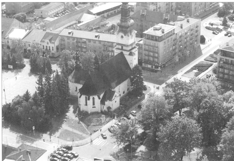
Obr. 2. Farský kostol sv. Alžbety, pohľad od severovýchodu.