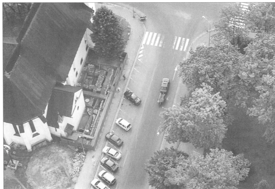
Obr. 3. Odkryté základy historickej radnice, pohľad od severovýchodu.