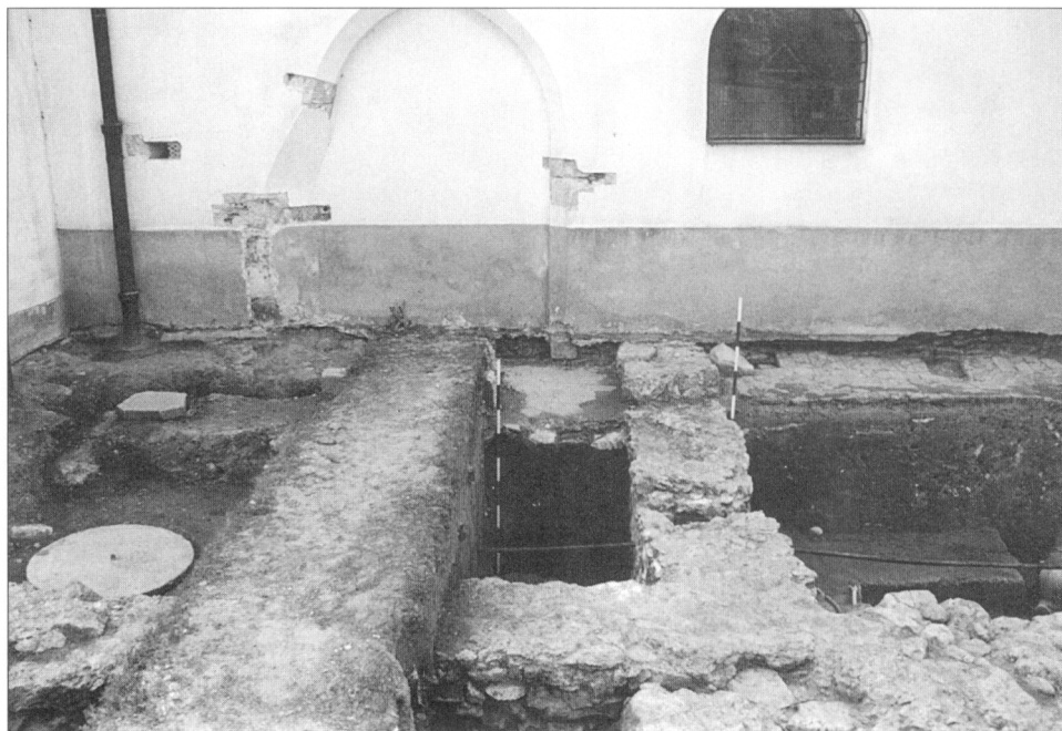
Obr. 4. Odkrytá časť základov a interiérového portálu medzi radnicou a loďou kostola, pohľad od severu.

Spoločným menovateľom pri umiestňovaní stavby radnice je výber najprestížnejšieho miesta, ktoré samo o sebe zvyšuje autoritu rozhodovania samosprávnych orgánov. Takým