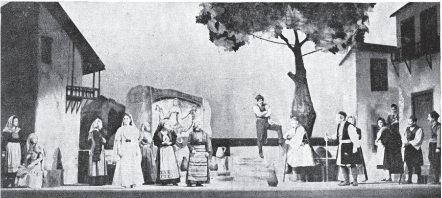
Εικ. 3 Τρισεύγενη (1963) στο ΚΘΒΕ. Σκηνικό του πρώτου μέρους (Νίκος Σαχίνης). Πηγή: Αρχείο παραστάσεων του ΚΘΒΕ (online). 64

©ΚΘΒΕ, φωτογράφος: Σωκράτης Ιορδανίδης (1963)