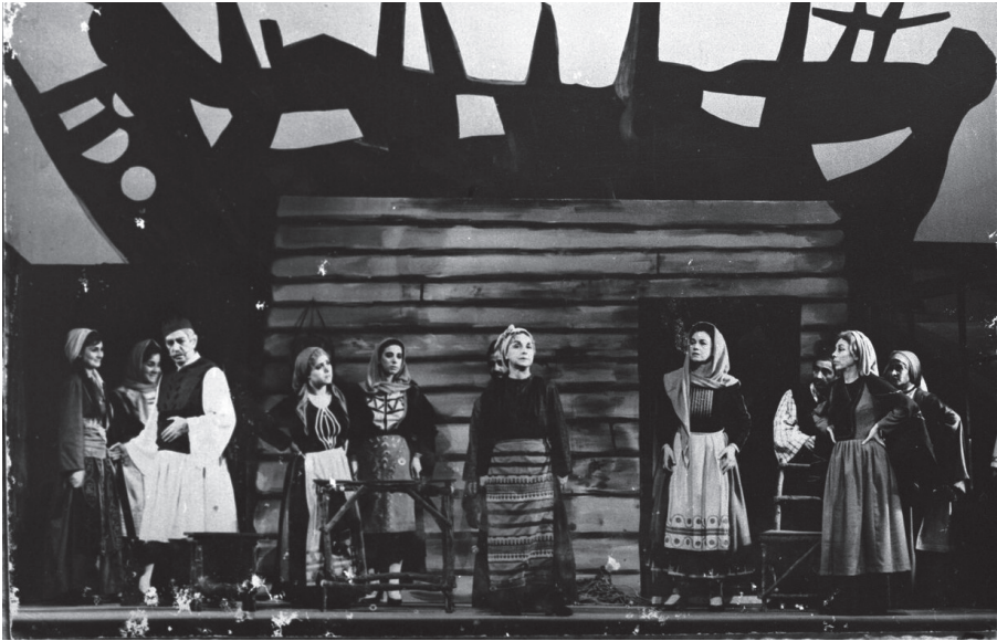
Εικ. 2. Τρισεύγενη (1963) στο ΚΘΒΕ. Σκηνικό του δεύτερου μέρους (Νίκος Σαχίνης). 63