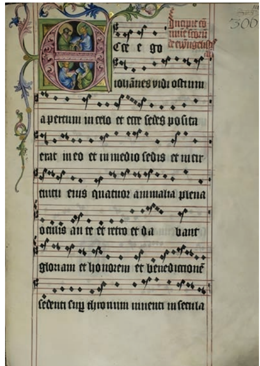
Abb. 2 Klosterneuburger Antiphonar Cod. 65 (Augustiner-Chorherrenstift Klosterneuburger Antiphonar Cod. 65 (Augustiner-Chorherrenstift Klosterneuburg, Stiftsbibliothek Klosterneuburg CCl 65, f. 302r). 17

Die veränderte Ästhetik der Kodizes vom Ende des Mittelalters nach dem Vorbild der italienischen Renaissance und des königlichen Skriptoriums in Buda wird einzig und allein nur durch das Budaer/Pressburger Antiphonar III (EC Lad. 6, Staatsarchiv Pressburg) dokumentiert. Ausschmückung, Schrift und Notationsstrukturen wurden durch die humanistischen Tendenzen und Usancen im Ofner Skriptorium beeinflusst. 19 In dem Kodex taucht eine spezifische Notation auf, die als Folge der Reformprozesse in der Buchkultur der zweiten Hälfte des 15. Jahrhunderts zu betrachten ist. Diese Kontaktnotationsschrift, die nicht als reine Metzergotische Notation angesehen werden kann, enthält mehrere archaische Strukturelemente der Graner Notation. Janka Szendrei