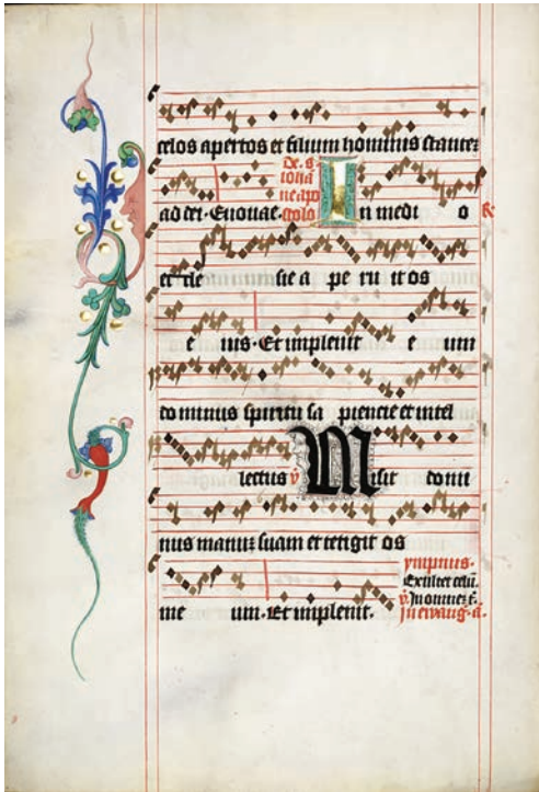
Abb. 1 Pressburger Antiphonar IIb SNA 4 (Slowakisches Nationalarchiv, f. 2v). 16