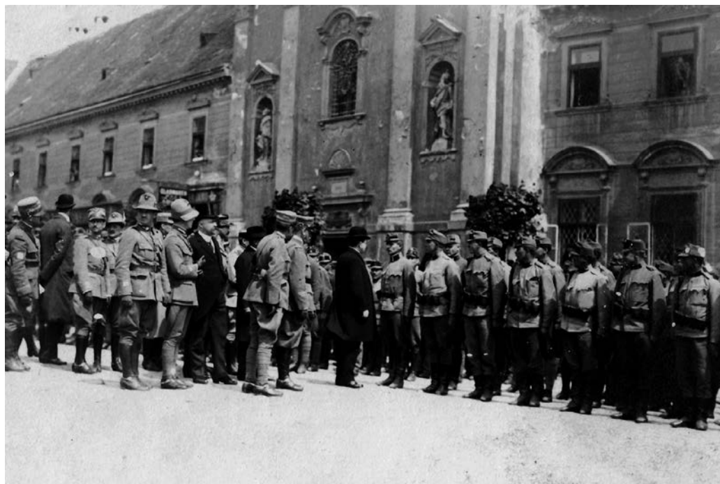
Vojenská ceremonie v Bratislavě s účastí italské vojenské mise a ministra národní obrany Václava Klofáče (sbírka autora).