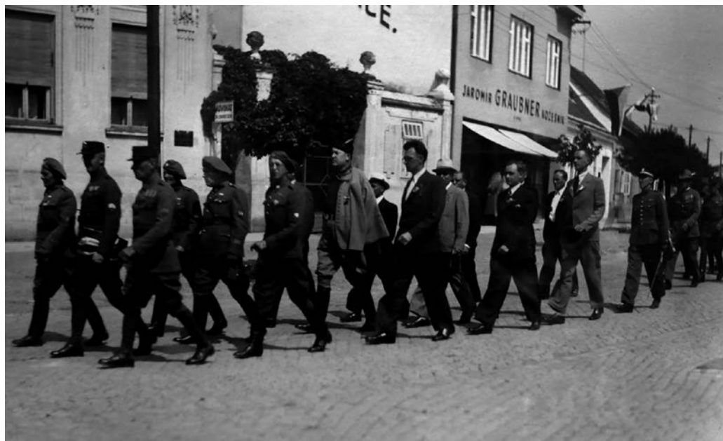
Branný sraz ve Strážnici ukazuje svornou spolupráci ve společném pochodu legionářských a nelegionářských veteránů.

Předáci sdružení se angažovali v přípravách a realizaci Husových oslav v roce 1925. Zmínku o jejich účasti na oslavách narozenin T. G. Masaryka však v tisku nenajdeme. Zůstává otázkou, zda se jedná o náhodu, nebo cílený bojkot. Můžeme však odvodit, že historické motivy hrály pro členy sdružení větší úlohu než osobnosti zahraničního odboje. Patrně se nejednalo o homogenní skupinu mužů. Jako poslední veřejné vystoupení na stranách denního tisku můžeme označit článek odsuzující nárůst fašistických tendencí v české společnosti, po jehož uveřejnění vydávání věstníku skončilo. 54 Můžeme prozatím pouze spekulovat, zda došlo k vnitřnímu názorovému rozkolu, nebo vydávání věstníku ustalo z objektivních důvodů nedostatku časových nebo finančních prostředků.