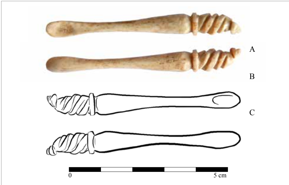
Obr. 6. Ušná lyžička z hradu Hrušov. A – predná strana; B – zadná strana; C – kresba prednej a zadnej strany. Foto a kresba S. Blahová.