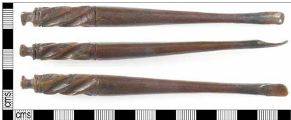
Obr. 9. Kostená ušná lyžička z Londýna. Podľa MacGregor 1985, ref. 57a.

Abb. 9. Knochenohrlöffel aus London. Nach MacGregor 1985, ref. 57a.