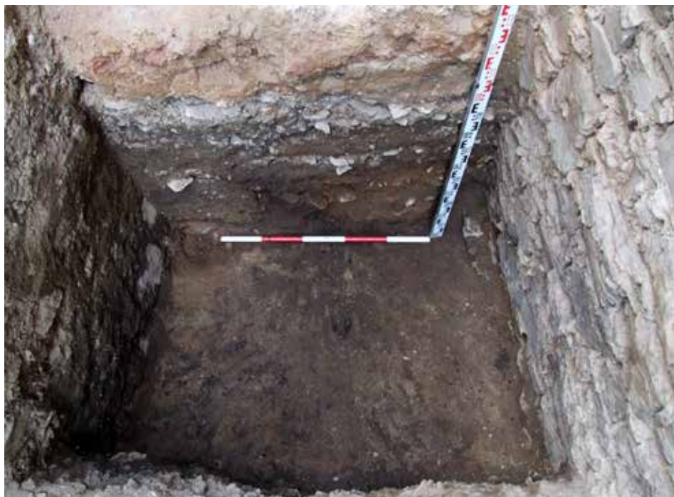
Obr. 5. Nálezová situácia.