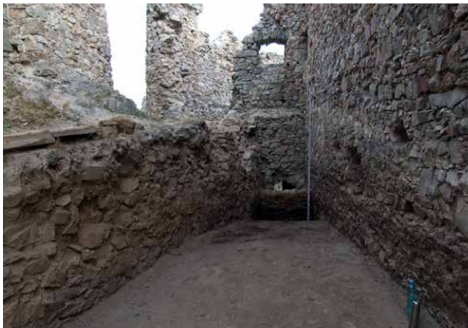
Obr. 4. Južná časť parkanu – archeologický výskum 2015.