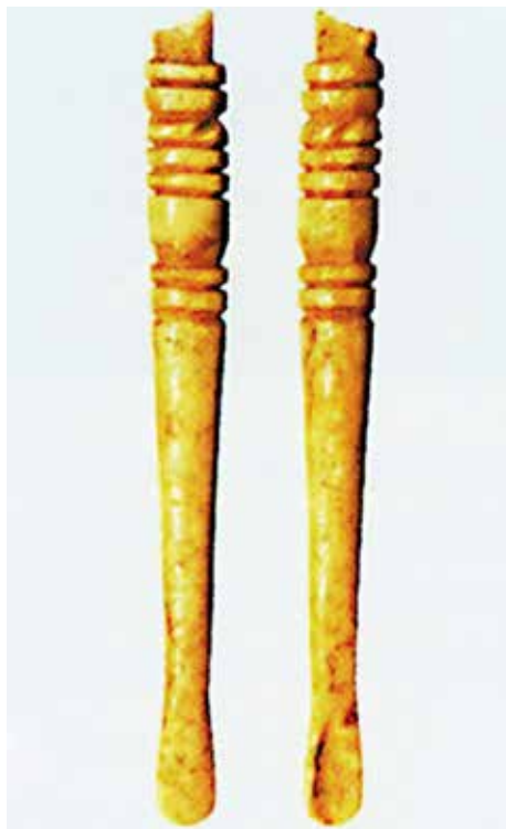
Obr. 8. Kostená lyžička z Chelmu. Podľa Chudzinska–Wołoszyn 2019, Ryc 8.2.7.d.

Vzhľadovo podobná ušná lyžička pochádza z Wysokej Górky z mesta Chelm (Chudzinska–Wołoszyn 2019, 244–245). Fragment kostenej lyžičky (obr. 8), dlhý 81,06 mm, vyrobený zo slonoviny má hornú časť rúčky zdobenú sekvenciou žliabkov, ktorá sa končí zlomom. Podľa B. Chudzínskej a M. Wołoszyna (2019) je datovaná do 12.–14. storočia.