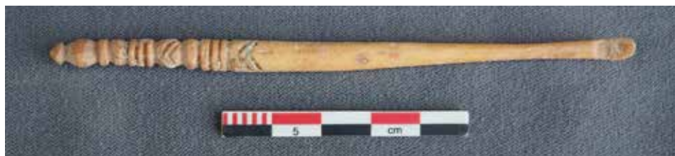
Obr. 10. Kostená ušná lyžička z hradu Thura v Maďarsku.

Abb. 9. Knochenohrlöffel aus London. Nach MacGregor 1985, ref. 57a.