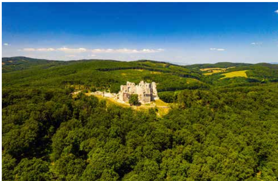
Obr. 1. Letecký pohľad na hrad Hrušov.