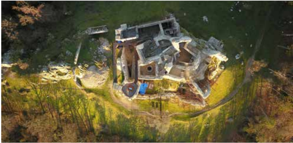
Obr. 3. Pôdorys hradu z leteckej perspektívy.