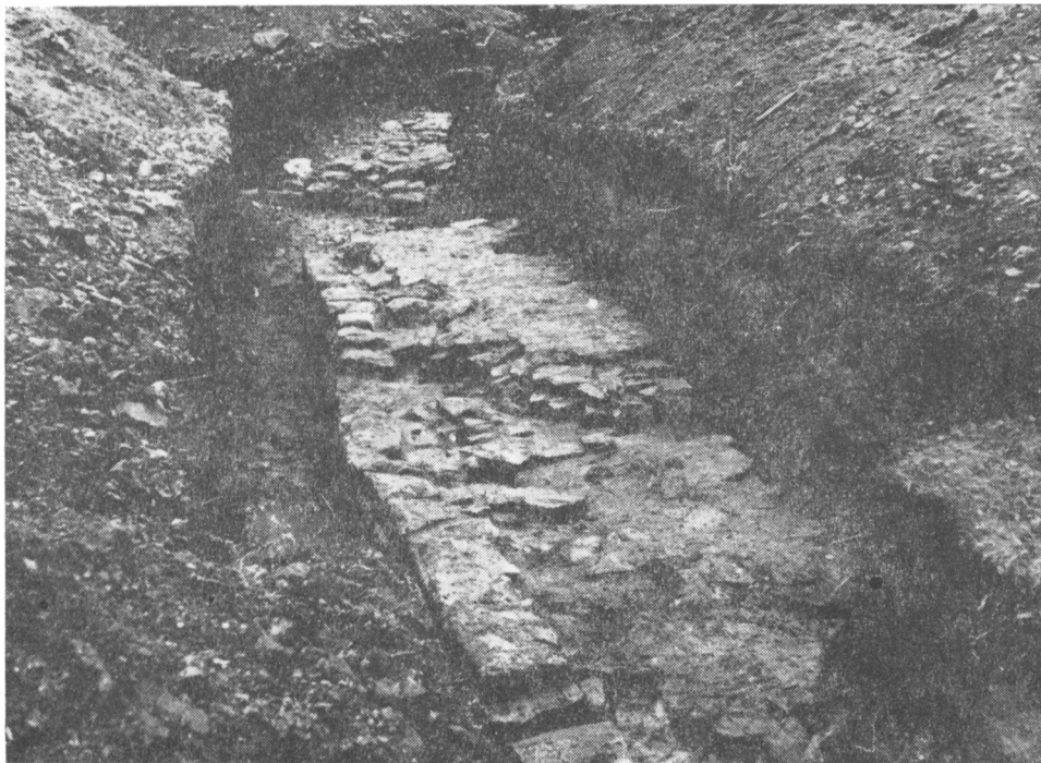
Obr. 4. Toušeň, hrádek. Pohled od západu do sondy 3D/78 a 3B/78 se základy hradební zdi. V horní části snímku základ přerušen výkopem z r. 1865.