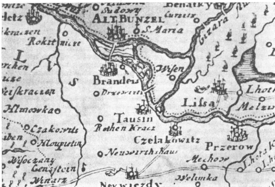
Obr. 1 Toušen, hrádek. Výřez z mapy M. Vogtan Nova totius regni Boemiae tabula. Norimberk 1712.

Dosavadní archeologické výzkumy prováděné na katastru Toušeně nám poskytují přehled o téměř průběžném osídlení od mladší doby kamenné po dnešek. Z písemných pramenů je dochována nejstarší zpráva hovořící konkrétně o Toušeni z 1. srpna 1293, dle které choť Václava II. královna Jitka, dala plat