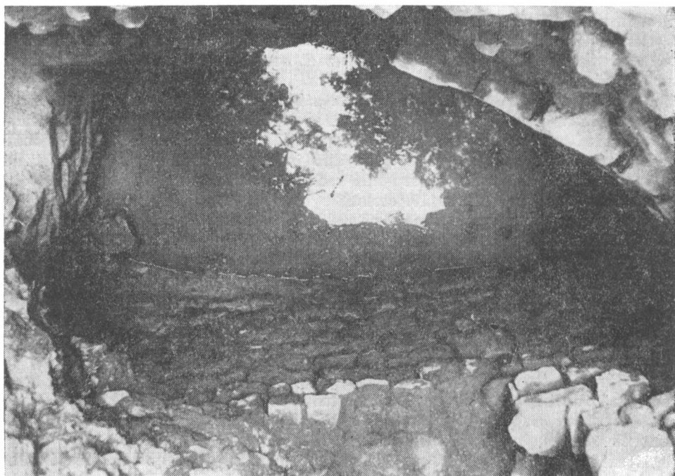
Obr. 3. Toušeň, hrádek. Sonda 1/78 s částí zachovaného pulkruhového objektu – cisterny. Vpravo objekt přerušen v mladší fázi hradební zdi.