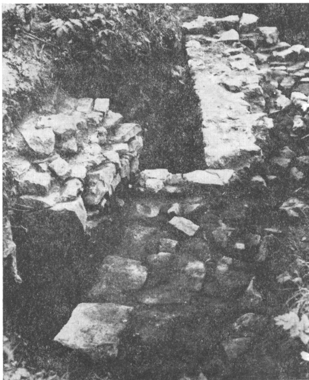
Obr. 5. Toušeň, hrádek. Část zdiva odkrytá v sondě 2B/77.