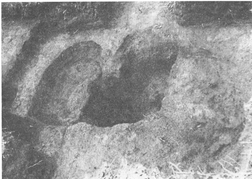
Obr. 2. Toušeň, hrádek. Pohled od východu na středohradištní objekt v sondě 8/77.