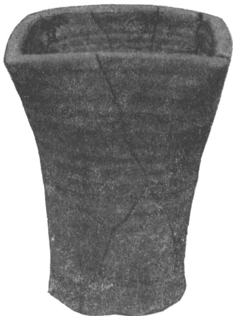
Obr. 6. Toušeň, hrádek. Tyglíkovitý kachel nalezený v západní stěně sondy 2B/77.

spíše kruhového tvaru o vnitřním průměru necelých 40 m. Hradební zdivo spojované maltou, dosahuje v základech mocnosti kolem 180 cm. V sondách 3B/78 a 3D/78 položených v severní části, bylo zjištěno přes 2 m široké přerušení základů hradební zdi (obr. č. 4), od kterého vně do příkopu pokračuje nízké roubení z kamene. Nalezené keramické i jiné zlomky z výplně těchto míst odpovídají době po vykopání nové mlýnské strouhy v roce 1865. Stejná situace byla zjištěna i v sondách 10/77 a 11/77, což nasvědčuje tomu, že strouha byla vedena téměř severojižním směrem přes střed bývalého hrádku. Se stavbou mlýnské strouhy nejspíše souvisí i neúplně zachované základy menšího zděného objektu, odkryté v sondě 12A/78, jehož vnitřní prostor byl vyplněn keramikou hlavně z 19. století.