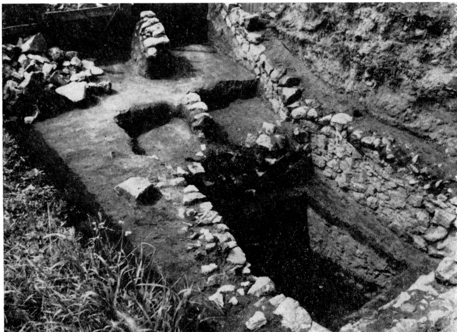
Obr. 3. Spodná časť architektúry vo východnej časti hradu.