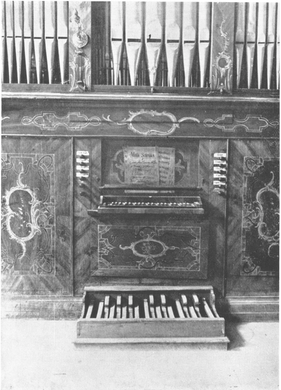
Prospekt der Orgel in der III. Blutskapelle zu Staus (Aufnahme des Verfassers).