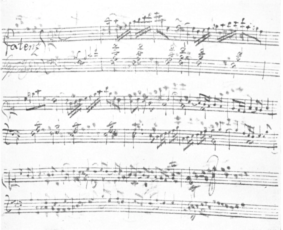
Aus J. M. Sparger: Wegweiser auf die Orgel , 1766. Mecklenburgische Landesbibliothek, Schwerin, Sign. 5121. Nachgetragene Kadenz Haydns.