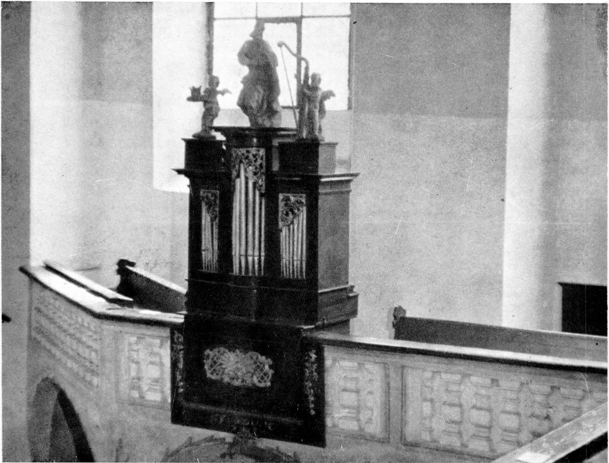
12. Das Orgelpositiv auf dem Literatenchor in derselben Kirche in Deutsch Brod (Havlíč- kúv Brod), wahrscheinlich aus der Zeit des Dekans Ant. Th. Stamic.