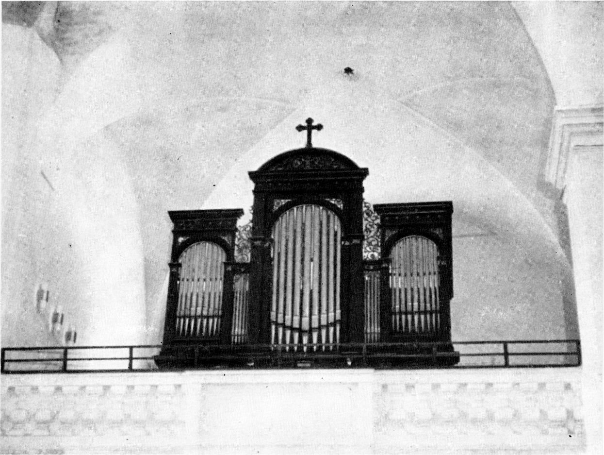
11. Das Musikchor in der Dekanskirche in Deutsch Brod (Havlíčkův Brod) mit der neuen Orgel aus der zweiten Hälfte des 19. Jahrhunderts.